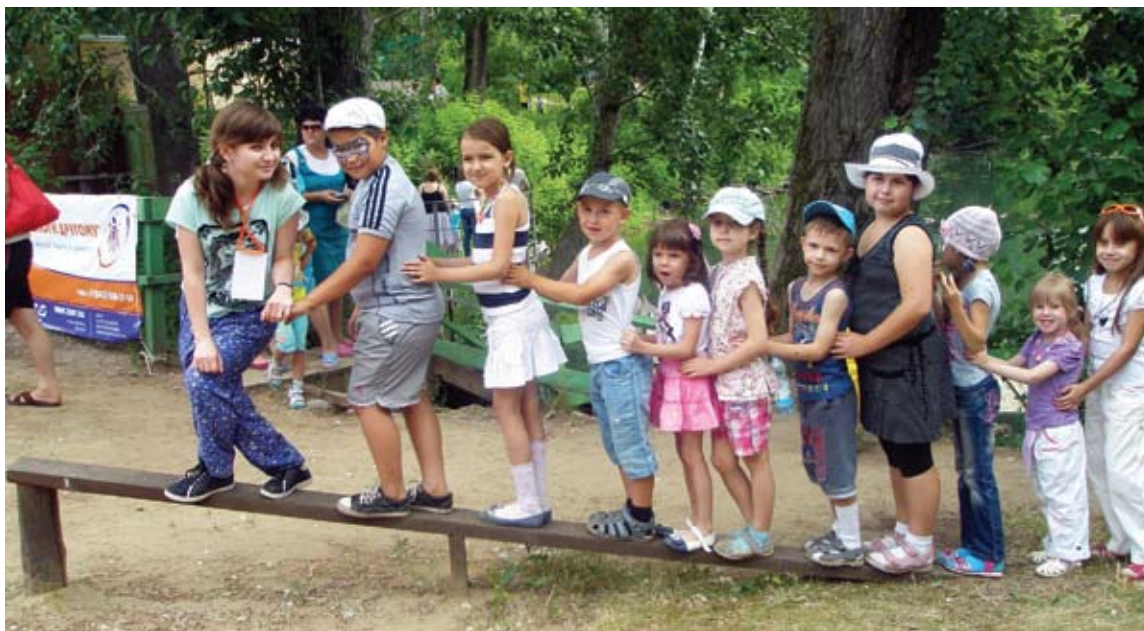
Праздник «Счастливое детство»: добровольцы общественной организации «Помоги другому» пригласили детей из Алексеевского дома-приюта в зоопарк

порадовали детвору весёлыми конкурсами, викторинами и сладкими призами. Детишкам сделали забавный аквагрим и показали шоу с шарами – многих ребят заворожило то, как из безжизненных воздушных шариков получались «собачки», «лебеди» и масса других зверьков и птиц. Праздничная программа завершилась вкусным обедом и открытием детского контактного зоопарка «Лукоморье», где малыши смогли поиграть с ручными животными.