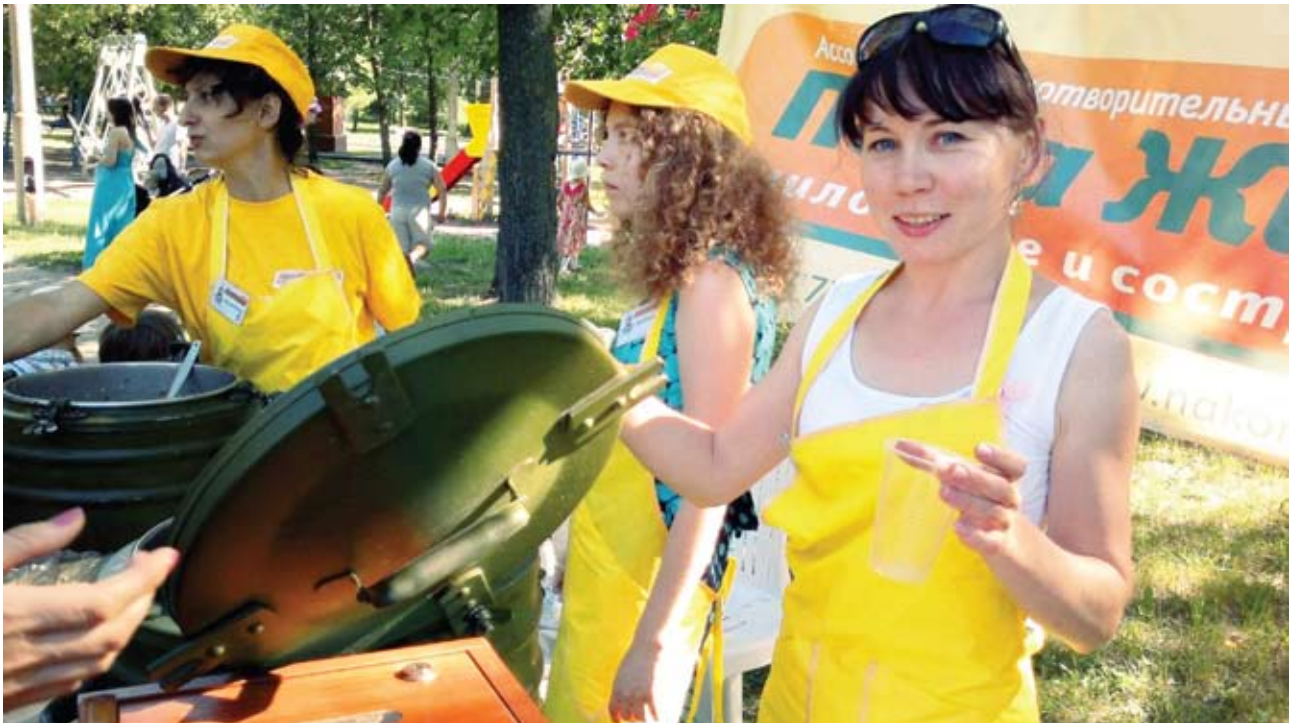
Волонтеры благотворительного фонда «Пицца Жизни» на детском празднике в парке «Крылья Советов»

фликтов. На территории России деятельность организации началась с оказания помощи при землетрясении в Армении в 1988 году. Мы обеспечивали питанием мирных жителей при военных конфликтах в Грозном, Сухуми, Цхинвале. На международной арене наши добровольцы помогали кормить голодных на острове Шри-Ланка после цунами в 2005 году, в Японии после катастрофы на АЭС «Фукусима» в прошлом году.