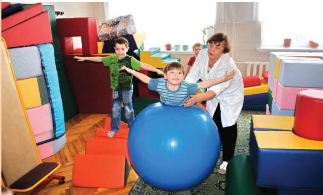
На базе республиканского детского психоневрологического санатория № 2 открылся дневной стационар для детей с заболеваниями центральной нервной системы

чить туда путёвку на реабилитацию, нужно выждать большую очередь. Эта проблема не раз поднималась родителями детей-инвалидов.