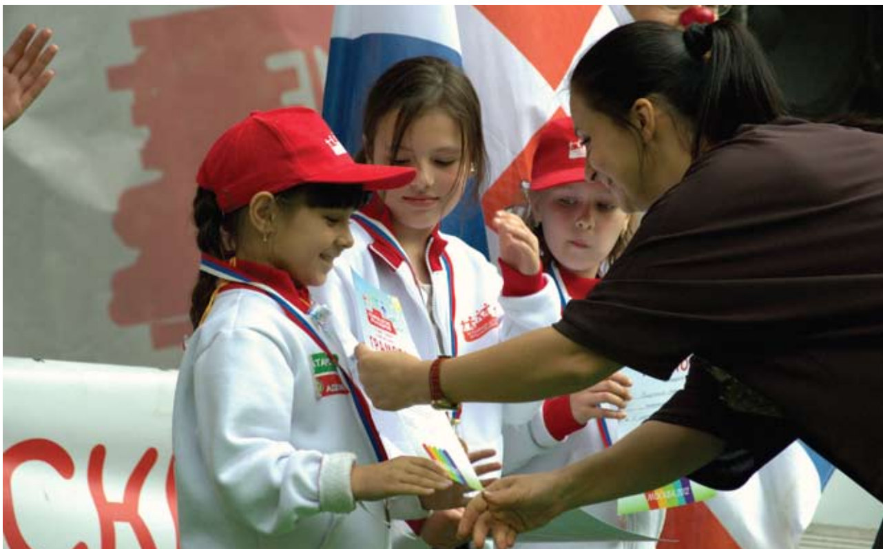
Всем участникам вручили медали и грамоты, а также игрушки и сладкие призы, а мамам – скороводки и косметические наборы от спонсоров

ческими возможностями были предусмотрены особые дисциплины – ходьба с поддержкой и заезд на инвалидных колясках.