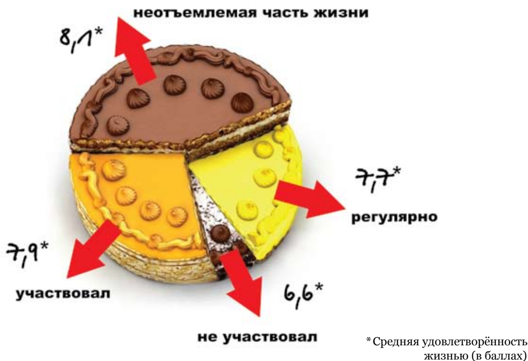
Рис. 2. В группе, принимающей самое активное участие в благотворительной деятельности, степень удовлетворённости самая высокая. У тех, кто не участвовал — самая низкая