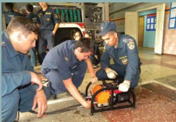
День открытых дверей для кадетов в пожарной части города Набережные Челны