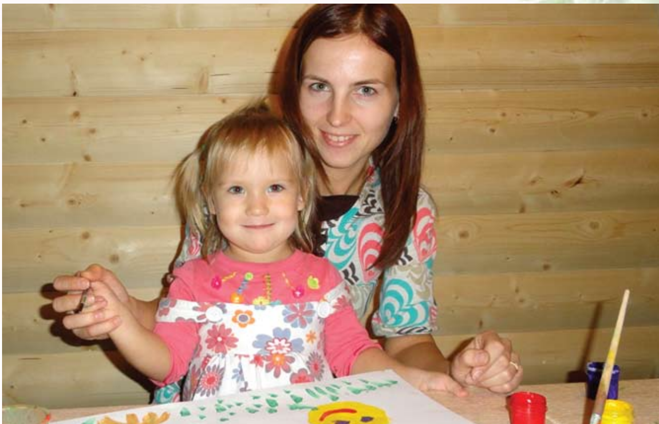
В правильно подобранной мамой терапевтической сказке ситуация главного героя напоминает ситуацию мальчика. История покажет ребёнку, что и другие испытывают такие же чувства, поможет мальчику накопить необходимый опыт

работа с психологами, которая помогает детям разобраться в себе и скорректировать поведение и образ жизни.