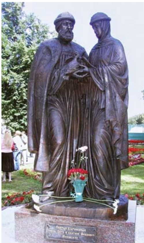
Памятник святым благоверным Петру и Февронии, открытый в Ярославле