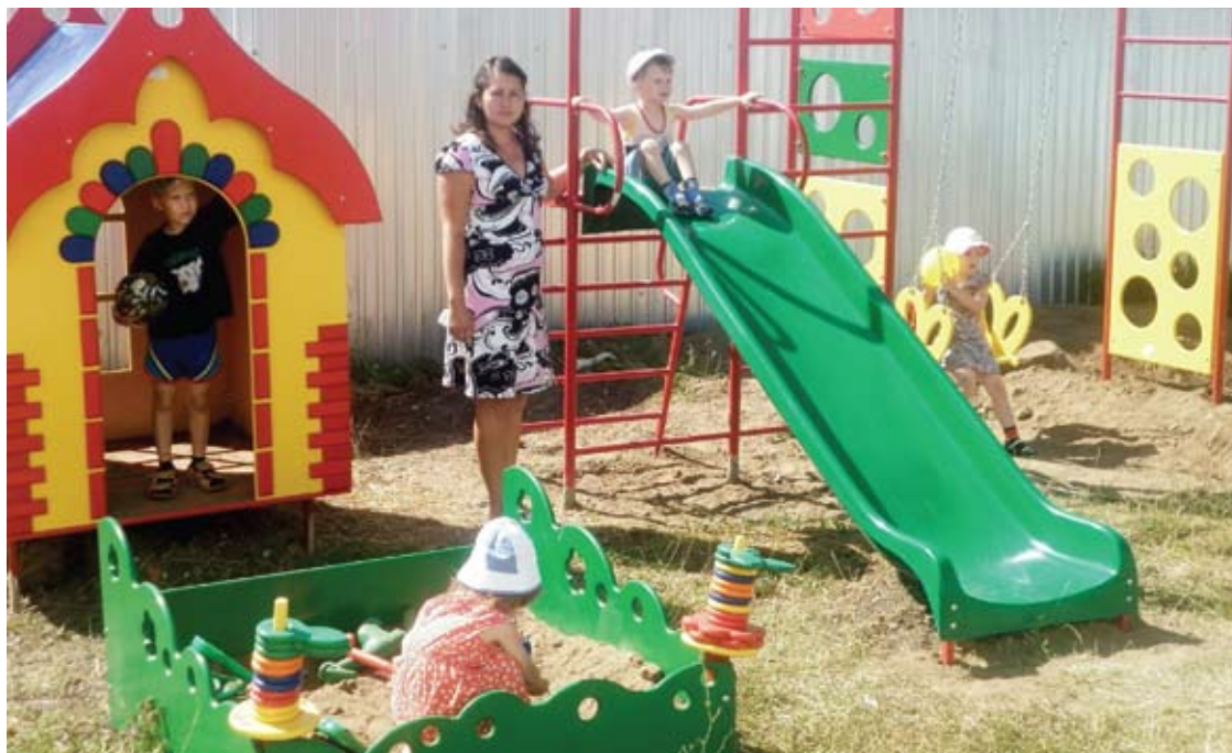
Благодаря неравнодушным людям на территории уже двух социальных приютов за лето установили детские площадки. Первая площадка с горкой, качелями и песочницей появилась в Пестречинском приюте

На всю Россию действуют всего четыре психоневрологических санатория: в нашей республике, Ивановской, Курганской и Калининградской областях. Очевидно: чтобы полу-