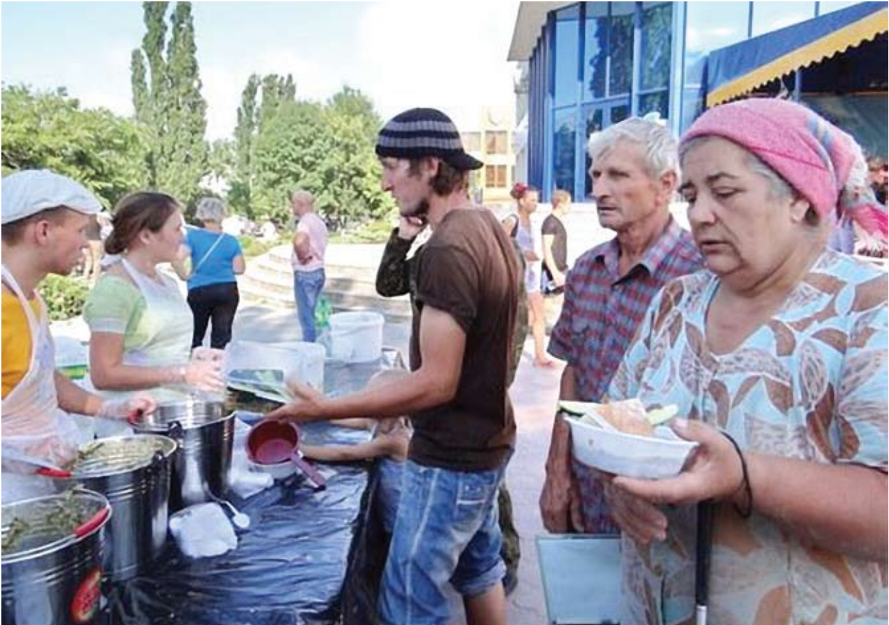
Волонтеры из казанского благотворительного фонда «Пища Жизни» оперативно выехали в Краснодарский край, чтобы помочь в организации горячего питания для пострадавших от наводнения

День защиты детей и т.д. — угощаем казанцев вкусными вегетарианскими блюдами.