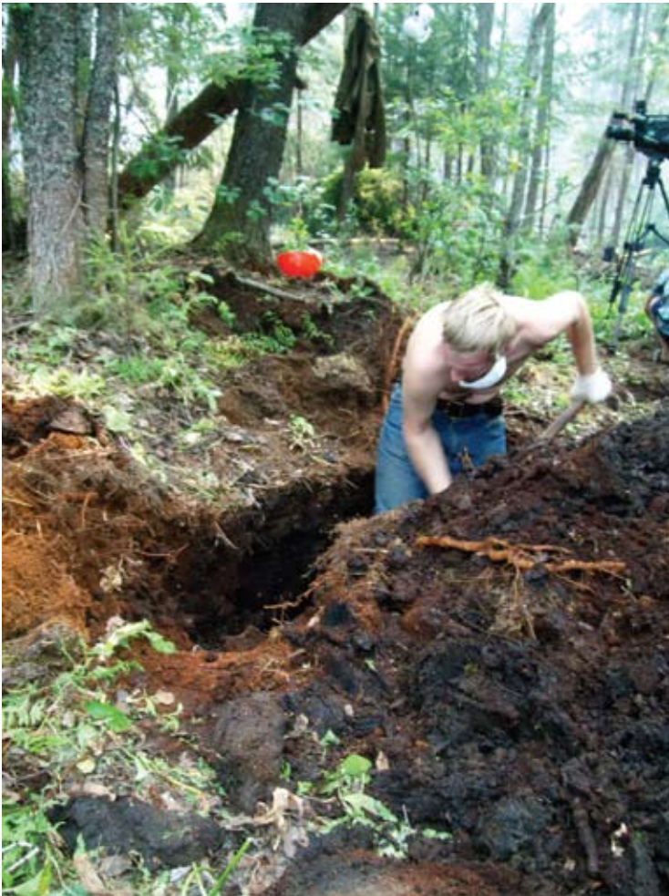
Низовой пожар останавливают с помощью глубоких (до самого песка) траншей

ли нас, что нужно постоянно осматриваться вокруг). Для этого и требуются бензопилы: задача — завалить в районе траншеи ближайшие деревья. Первым