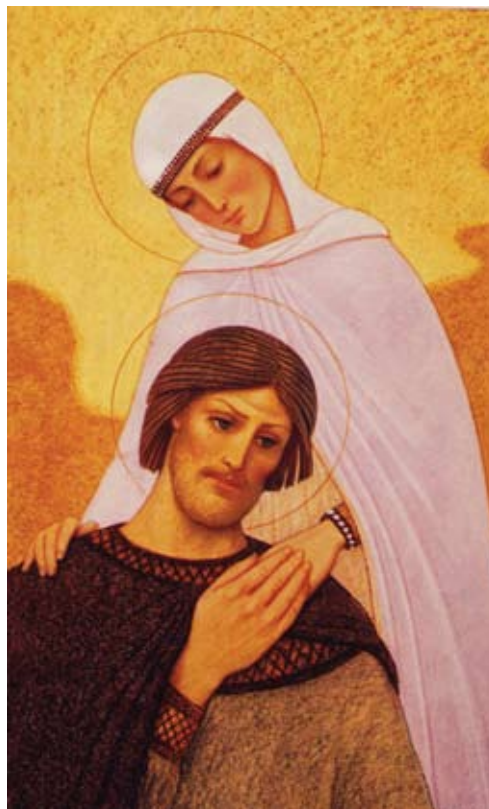
Князю Петру было проще расстаться с властью, чем со своей верной супругой

Блаженный князь Пётр, правивший на Муромской земле в XIII веке, взял в жёны простую, но очень мудрую девушку Февронию, в благодарность за то, что она исцелила его. «Жили они благочестиво, ни в чём не преступая божии заповеди», однако бояре невзлюбили княжну за её простое происхождение и решили прогнать из города. Князю же Петру было проще расстаться с властью, чем со своей верной супругой, поэтому сели они на ладью и уплыли из Мурома по матушке Оке. Но не долго пришлось им скитаться — городские вельможи в погоне за властью перебили друг друга, а те, кто уцелел, молили князя о возвращении. «Блаженный князь Пётр и блаженная