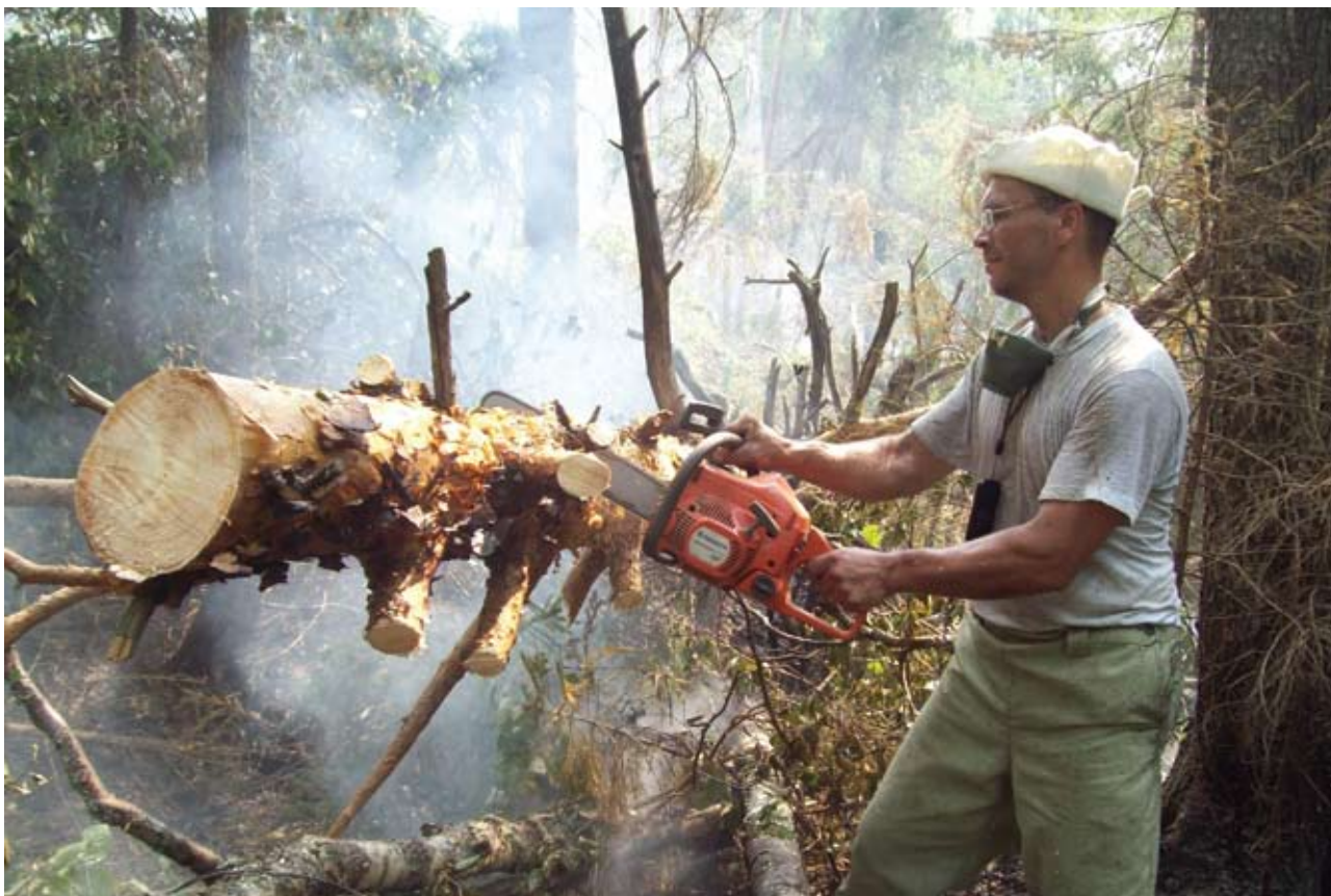
«Задача человека с пилой — завалить в районе траншеи ближайшие деревья. Кроме того, нужно выпилить стволы, чтобы огонь не смог по ним пробраться, и обрезать всю крону, иначе эта шапка вспыхнет»

нечему, и верховой пожар тухнет. Однако низовой всё равно остаётся, так как с деревьев слетают горящие ветки. Кстати, из-за того, что ветки разлетаются во все стороны, верховой пожар может перепрыгивать даже большие расстояния — дорога или река для него не преграда! Низовой