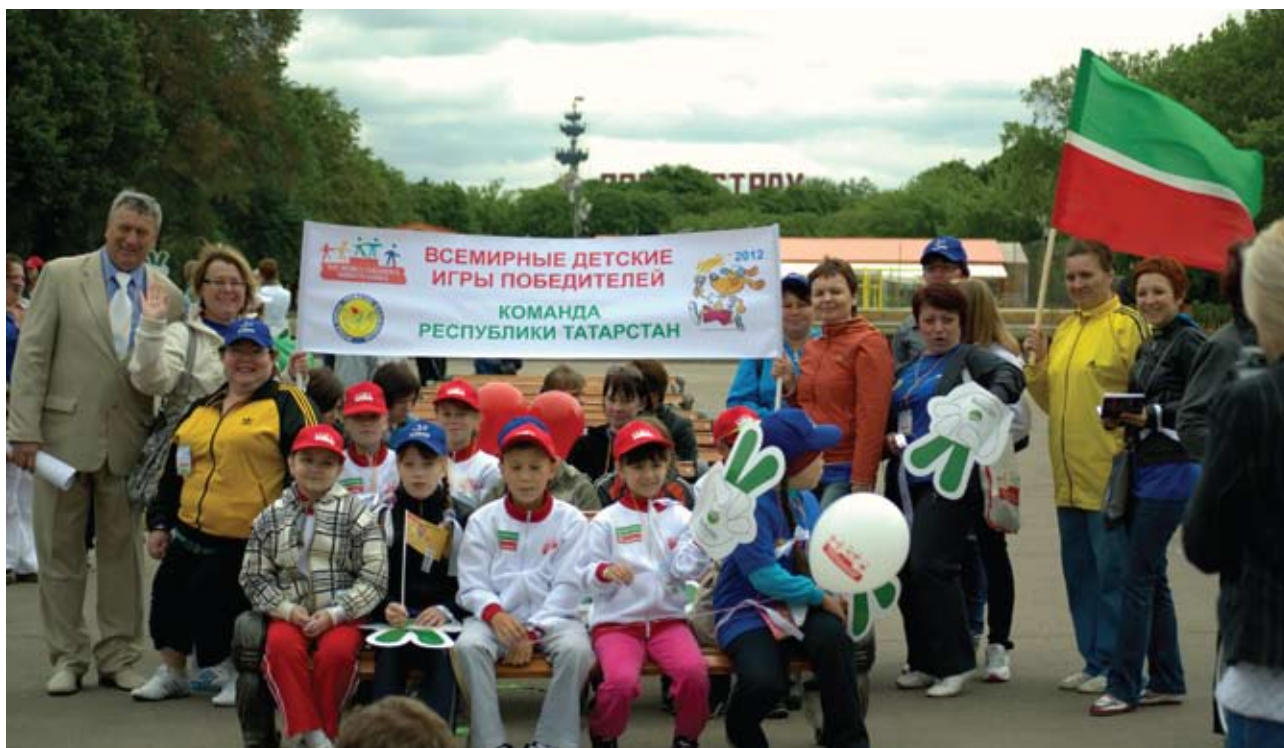
Команды, по традиции, были интернациональными — «сборные мира», такая игра помогает преодолеть языковой барьер и найти новых друзей из разных стран