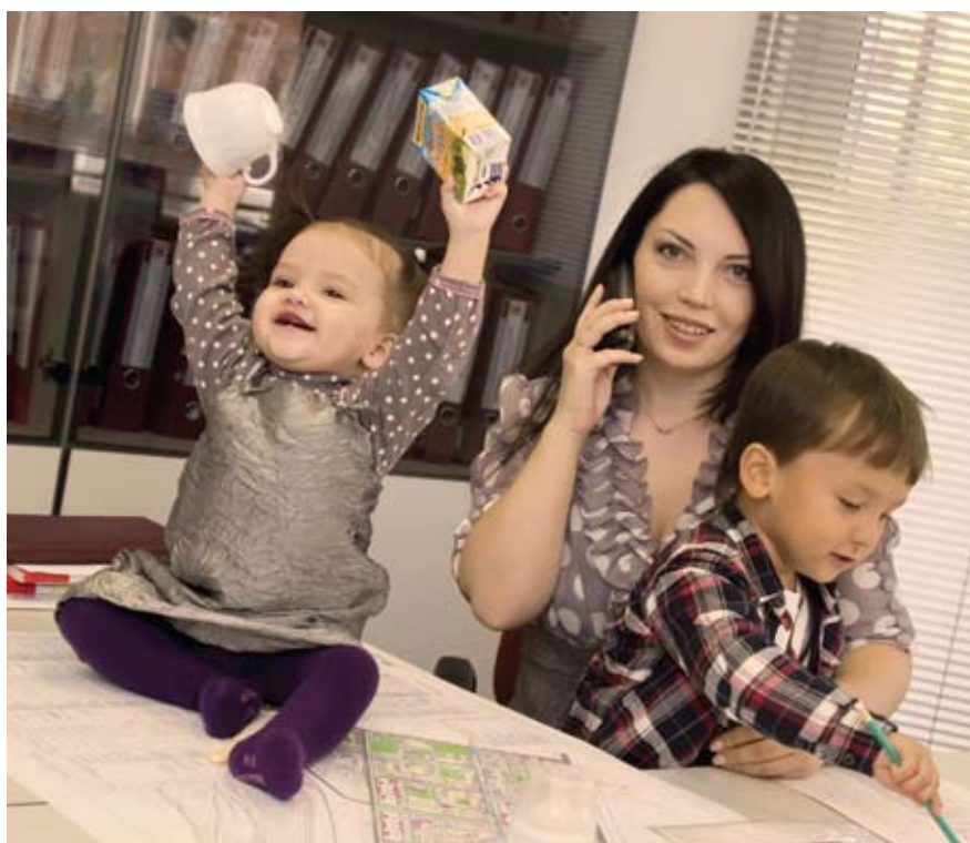
Рис. 1. На основании социопроса, проведённого общественной организацией «Мамы Казани», можно составить портрет татарстанской благотворительницы

В том, что благотворительность в Татарстане стимулируется государством, уверены только 4 процента. Тем не менее, 3/10 опрошенных считают, что государство оказывает поддержку благотворительным организациям. В то же время 2/10 заметили, что от государства больше препятствий, чем пользы. В кризисной ситуации в государственные социальные службы обратились бы 34 процента опрошенных.