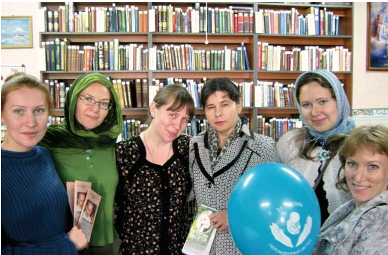
Психологи Центра защиты материнства и детства: «Мы помогаем будущим мамам, потому что наш девиз — «предупредить легче, чем реабилитировать». И нам безразлично, что будет со страной, в которой мы живём!»