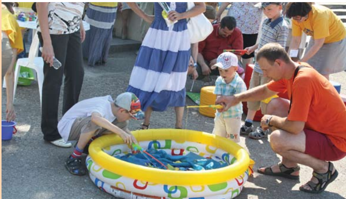
В казанском парке Победы прошёл праздник под названием «Её величество – семья»: пока родители общались со специалистами, детишки участвовали в конкурсах и других развлечениях