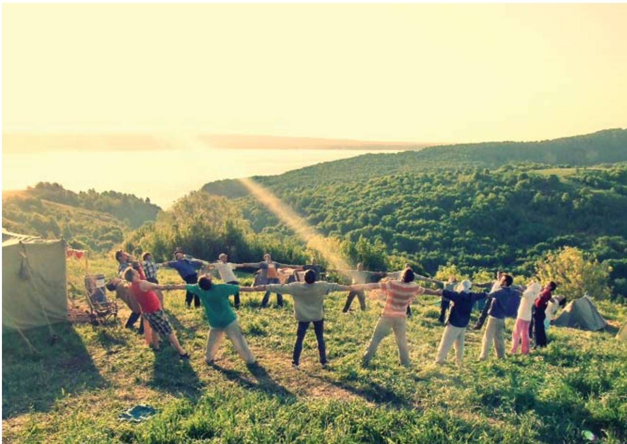
Пребывание во время смены лагеря на территории заповедников и национальных парков учит, воспитывает, формирует экологическое мировоззрение. Участники проекта попадают в иную реальность – в мир, где природа – полноправная хозяйка

их с тем, как можно построить экологичное жильё, создать экосады и огороды с помощью методов природного земледелия и грядок Зеппа Хольцера.