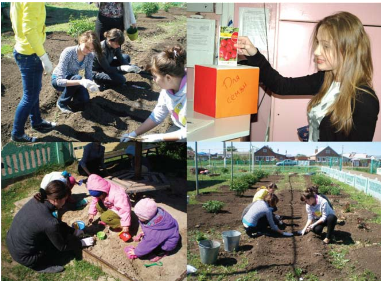
Благодаря реализации программы дети не только обеспечены выращенными на своём огороде фруктами и овощами, но и получают полезные навыки, как хозяйственные, так и коммуникационные

ветов «бывалых» был объявлен в 2010 году. Сотрудники фонда совместно с волонтерами рассказывали покупателям садоводческих магазинов Казани про акцию «Свой огород» и предлагали им купить товар не только для себя, но и для воспитанников детских социальных учреждений. Так были собраны более полутора тысяч упаковок семян, а также рассада и полезная утварь для хозяйства: лейки, перчатки, грабли и т.д. Всё это было передано в одиннадцать учреждений республики ранней весной и, несмотря на аномально жаркое лето 2010 года, ребята при помощи своих воспитателей и волонтеров собрали прекрасный урожай!