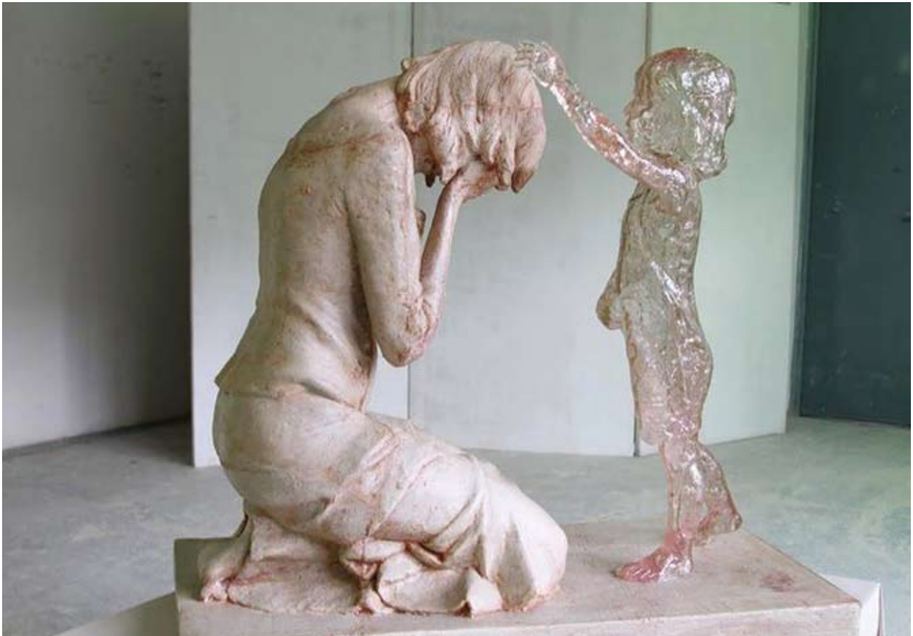
Этот памятник нерождённым детям был установлен 28 октября 2011 года в Словакии. Он символизирует душу ребёнка, утешающую убитую горем мать