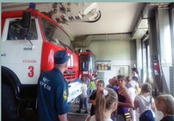
Дни безопасности в оздоровительных лагерях города Казани

Не зря же Всероссийское (а некогда – Императорское) добровольное пожарное общество было создано еще 120 лет тому назад. Свой юбилей общество отметило 15 июня этого года, а в следующем году Казанскому добровольному пожарному обществу исполнится 50 лет!