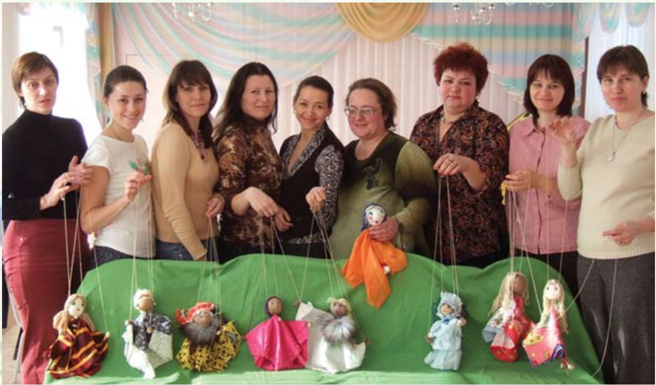
Важный элемент игры — куклы-марионетки. Ведь кто такой кукловод? Тот, кто может управлять — управлять своими эмоциями и желаниями. Так формируются процессы саморегуляции ребёнка