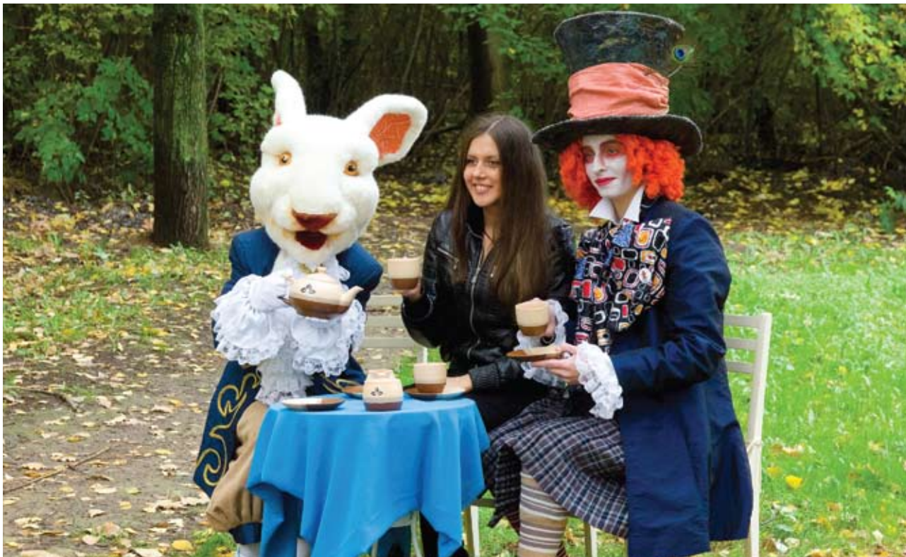
Почувствовать себя в роли Алисы на безумном чаепитии у Шляпника и Белого кролика могли участники акции «Доброе Дело № 3» в парке аттракционов «Кырлай»