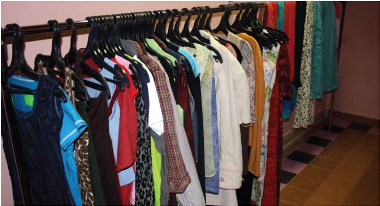
«В чём прелесть благотворительного магазина — здесь всегда будет неповторимый ассортимент: и хенд-мейд, и раритеты, и оригинальные вещи 80-х годов»