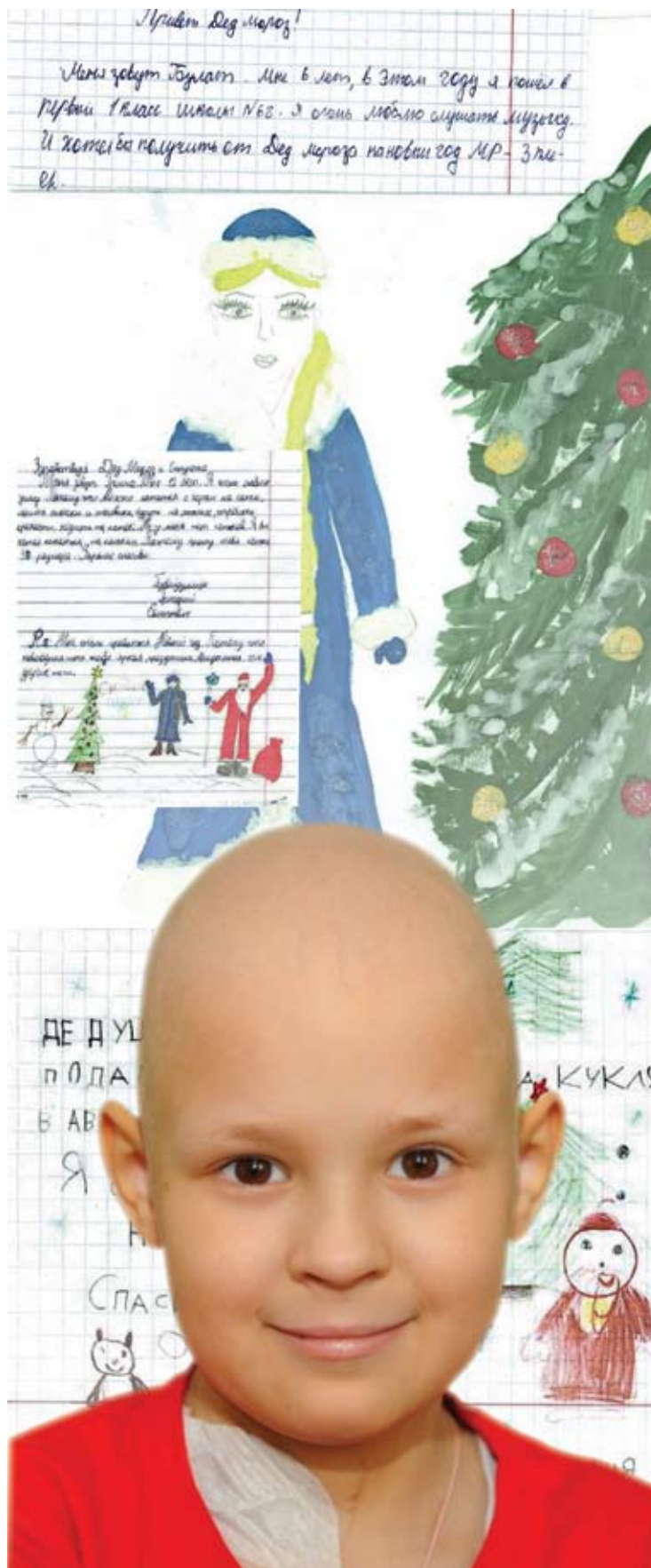
«Сын мне признался, что в сказку он больше не верит. Тайну подарков от Деда Мороза ему уже раскрыли ребята из больницы»