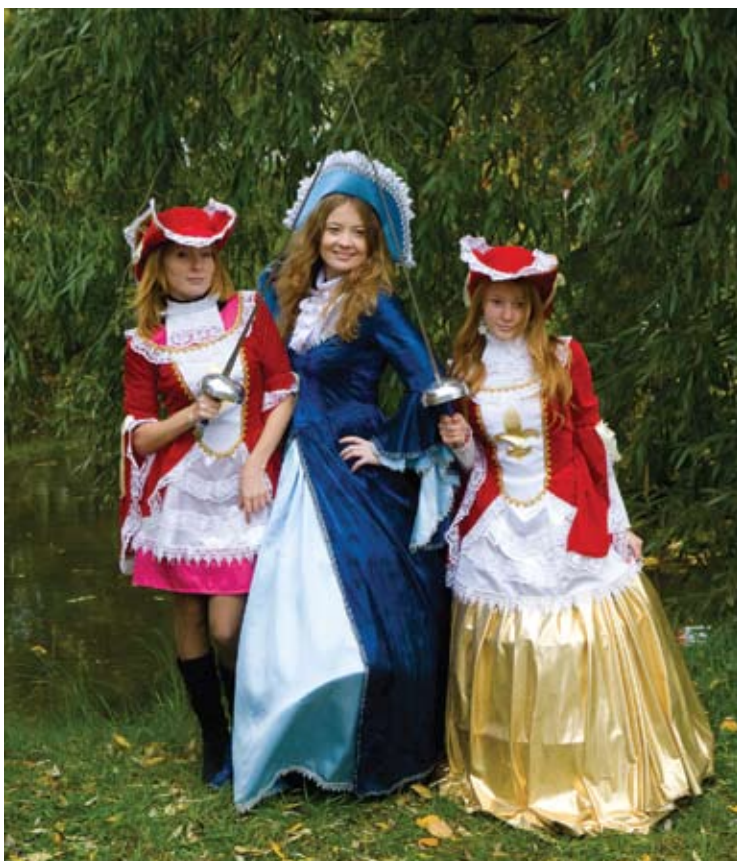
Пришедшие на праздник люди смогли получить отличные фотоснимки от профессиональных фотографов города

о разрешении использовать идею проекта за пределами столицы Татарстана.