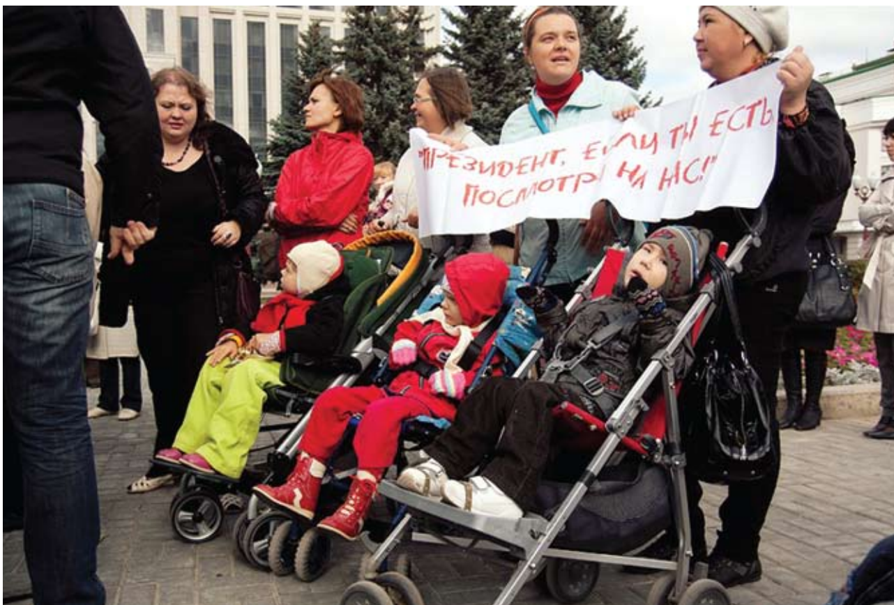
«Во время митинга мы потребовали от властей расширения существующих центров и увеличения сроков реабилитации, чтобы чиновники исполняли то, что прописано в федеральном законе»

что очень неудобно, учитывая состояние здоровья наших малышей и многочисленные пробки, ставшие сегодня непременным атрибутом Казани. После нескольких часов тряски в автобусах пользы от занятий не останется, дети утомятся. О каком качестве реабилитации после этого может идти речь?