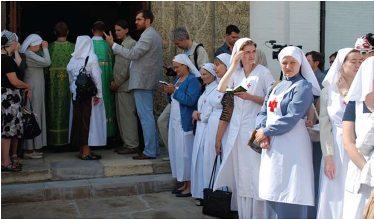
Нынешним летом, в День семьи, любви и верности, состоялся Первый съезд духовников и старших сестер милосердия Русской православной церкви