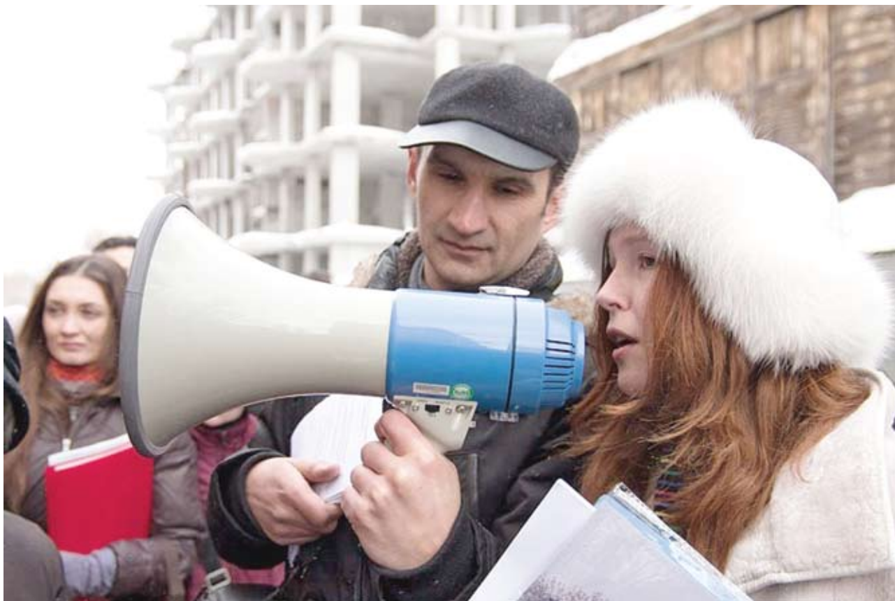
Просветительская экскурсия «Прогулки по старому городу. Казань, которую мы теряем»: «Наша акция собрала около восьмидесяти человек – это для Казани очень много»

ких этих экскурсий переполох до сих пор не прекращается: полетели головы чиновников Татарстана, на многих площадках строительство приостановили.