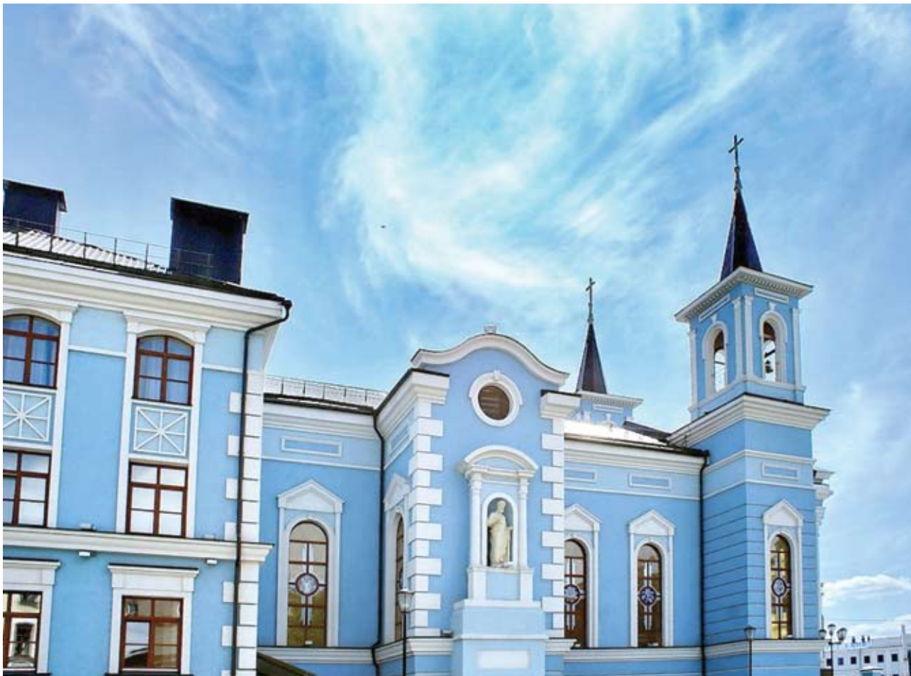
Приходской центр «Воздвижения Святого Креста» Римско-католической церкви