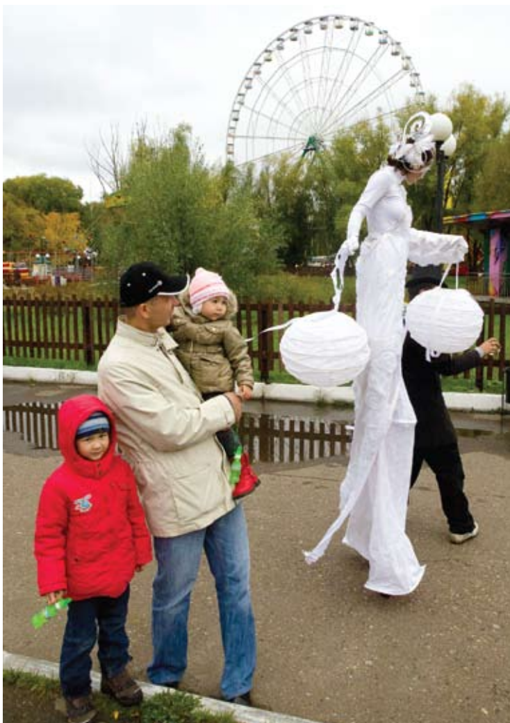
«Мы очень надеемся, что «Добрые Дела» станут традицией и к нам примкнут другие добрые и бескорыстные люди»

– Акция «Доброе Дело № 3. Поможем Савве» собрала около восьмидесяти тысяч рублей. Даже по завершению её нам передавали деньги желающие помочь. Всего же проект дал возможность перечислить на благотворительность уже более ста шестидесяти тысяч рублей. Такого результата невозможно было бы добиться без участия наших друзей и партнёров.