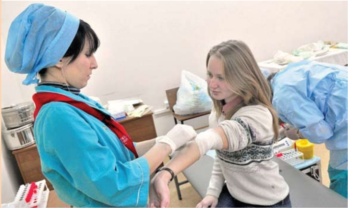
Акция по сдаче донорской крови «Подари сердце городу!»: в ней участвовали более трёхсот человек, из них около восьмидесяти стали донорами, а это более тридцати литров крови!

исходящее, помогали друг другу и пообещали организаторам, что дома обязательно сделают ещё такие куклы для своих ребяткишек и в подарок своим близким. Организаторы надеются, что навыки, приобретенные в ходе мастер-классов, будут полезны всем участникам, и приглашают специалистов, готовых поделиться своим опытом.