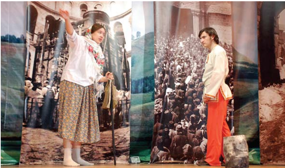
В Национальном культурном центре «Казань» прошел первый в истории Казанской епархии православный театральный молодёжный фестиваль «Божественная искра»

ской епархии был объявлен отборочный конкурс, победители которого и стали участниками фестиваля. В течение нескольких часов молодёжные коллективы демонстрировали свои таланты в области театрального искусства, показывая небольшие спектакли на евангельские темы, темы добра и зла, любви и преданности, а также продемонстрировали танцевальные и песенные номера. По итогам фестиваля жюри выбрало самые талантливые коллективы, которым были вручены специальные грамоты и ценные призы.