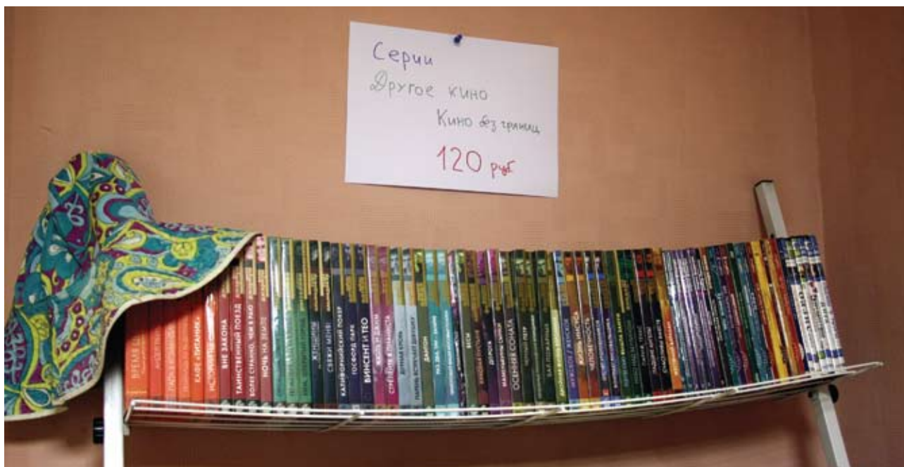
Коллекция представленных в чаритишопе видео- и аудиодисков способна привести в восторг много видео- или меломана