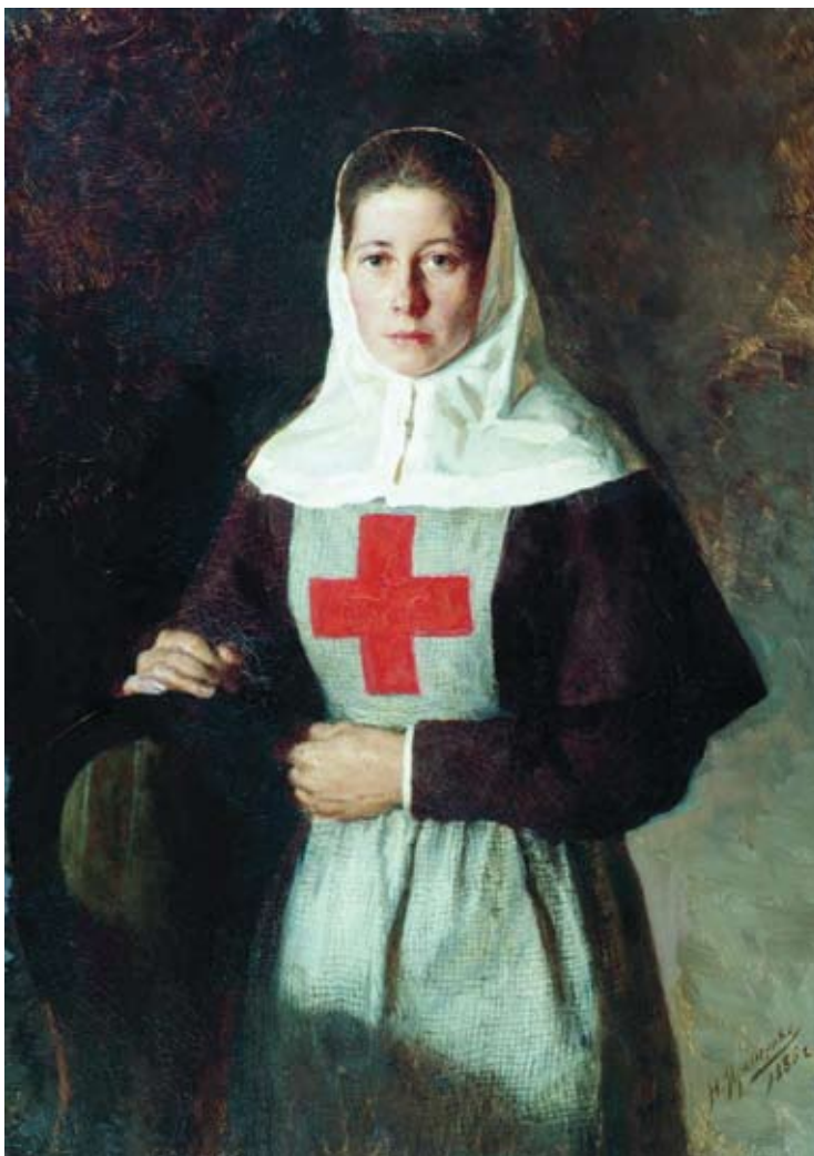
«Сестра милосердия», картина Николая Ярошенко, 1886 год

Правда, некоторые достижения цивилизации несколько облегчили труд сестёр. Например, с помощью современных средств связи они могут обучаться своему ремеслу дистанционно, черпать информацию из интернета и обмениваться опытом с коллегами со всей России. Для того же, чтобы обмен этот был более эффективен, год назад была создана Ассоциация сестриществ милосердия. В её задачи входит формирование единой базы данных об общинах сестер милосердия Русской православной церкви; содействие изданию литературы, предназначенной для обучения