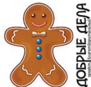
Веселый логотип проекта никого не оставляет равнодушным

– В социальной сети «В контакте» у нас есть группа. Адрес www.vkontakte.ru/Dobrye_Dela , присоединяйтесь! ОС