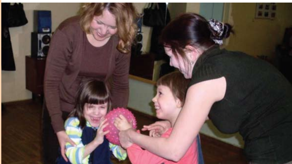
Специалисты недавно открывшегося клуба для мамы и ребёнка «Свет в окошке» будут помогать детям с нарушениями зрения, слуха, речи, умственного развития, поведения