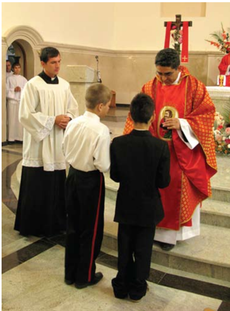
«Моя задача – создать атмосферу солидарности между людьми. И это получается, потому что приход – это как большая семья»

– Не уверен, что правильно будет называть принятое в семье традицией... Если