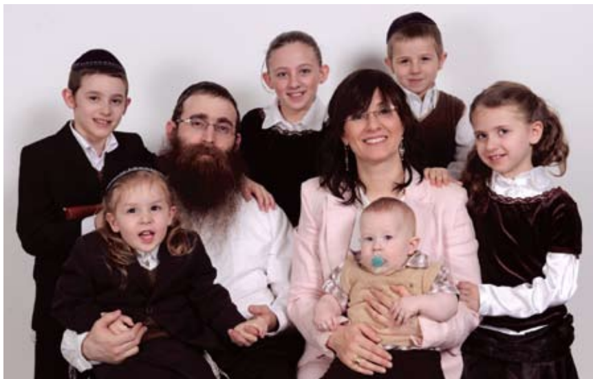
Главный раввин Татарстана с супругой и детьми

Книга «Мишне Тора» была написана в 12-м веке. Раби Моше бен Маймон работал над ней на протяжении десяти лет. В книге систематизированы все законы, которые обязаны выполнять евреи, будь это законы Торы или законы, установленные мудрецами.