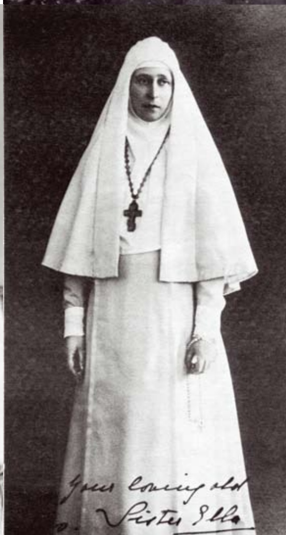
Большую часть своей жизни Великая княгиня посвятила служению Богу и обществу