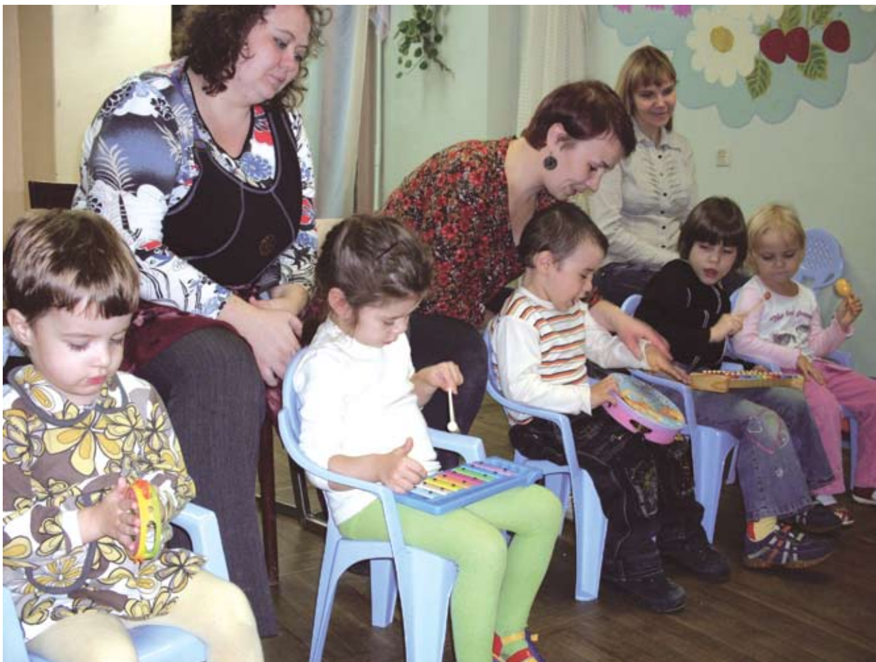
В клубе «Надежда» ребята учат петь, танцевать, рисовать, лепить из пластилина, делать поделки из цветной бумаги. И уже через несколько уроков дети начинают создавать свои маленькие художественные шедевры

помещение на базе подросткового клуба, где мы теперь проводим занятия с детьми и их родителями, а также ежемесячно устраиваем яркие праздники.