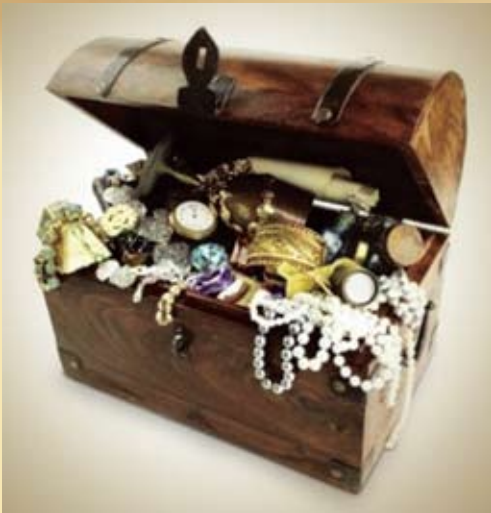
А купец в ответ: «Тогда плати мне за то, что ларец здесь стоит, — или скатертью дорога!»

да игрух разных, чтоб попрочнее да понадёжнее. А то ведь в домах-то сиротских иных и не надо, поломают».