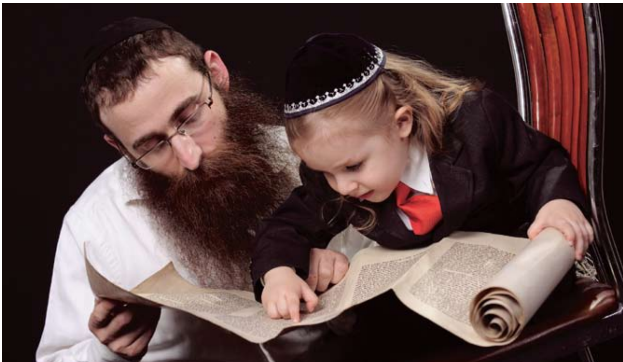
Сыновья раввина начинают изучать Тору с трёх лет