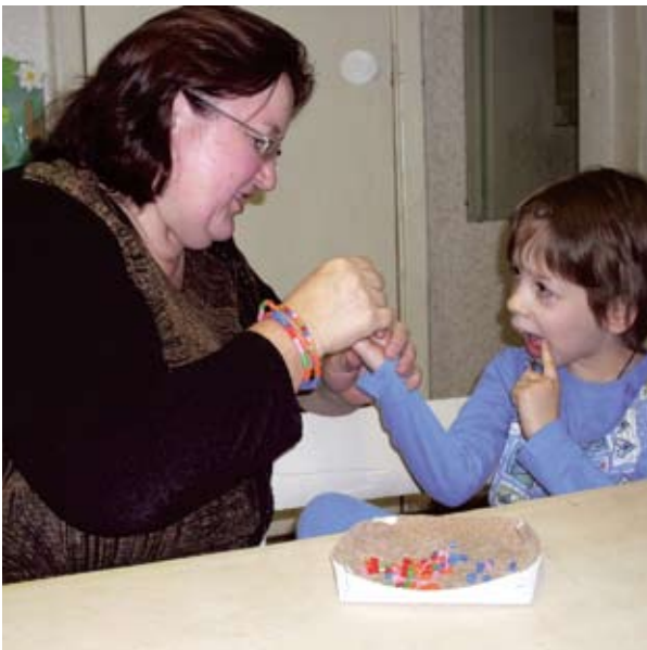
Клубу всегда нужны волонтеры, которые умеют и любят работать с детьми