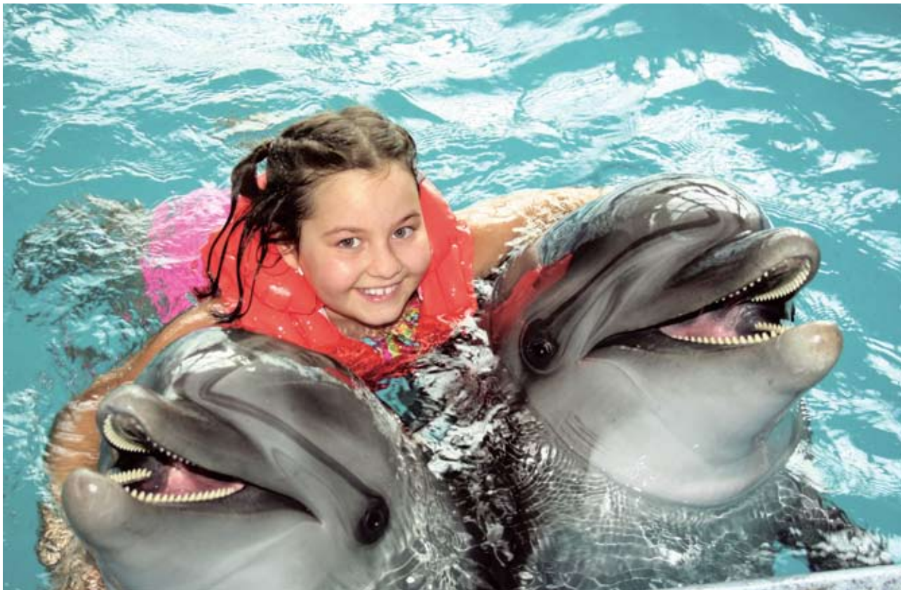
Набережночелнинский филиал Анапского дельфинария на Большом Утрише: незабываемый День рождения с дельфинами!

то есть на помосте, — объясняют сотрудники дельфинария. — Потом занятия плавно перемещаются в воду. Но всё строго индивидуально и проводится согласно основному медицинскому принципу «не навреди!»: кому-то из ребятшек одно показано, а другое — противопоказано.