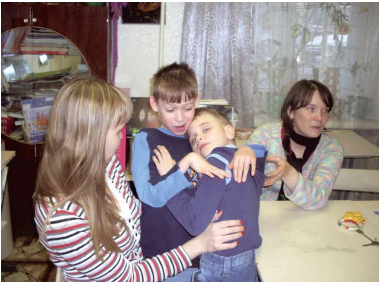
На занятиях дети, которые раньше были «заперты» в четырёх стенах своего дома, познают радость общения со сверстниками и проходят социализацию

готовы принять их лишь на четыре месяца в году. Проект «Надежда» помогает заполнить эту нишу. Сейчас клуб посещают около двадцати детей, но с каждым месяцем их становится всё больше.