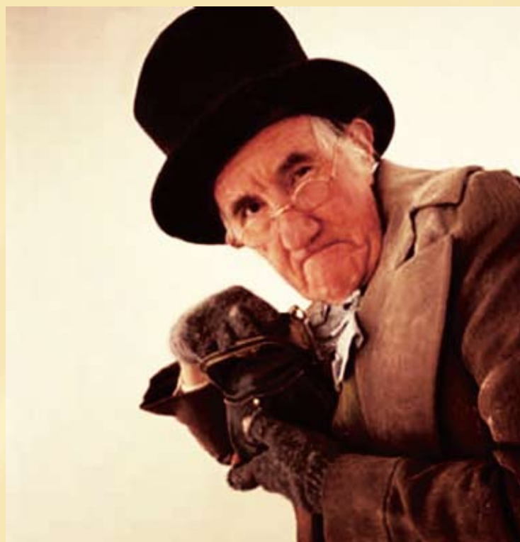
Вот вроде бы и сказке конец, ан нет: купец-то мастеру ларцов назаказал, аж на все свои три лавки...

От автора: сказка, к сожалению, основана на реальных событиях. Текст, выделенный жирным шрифтом, — цитата из жизни.