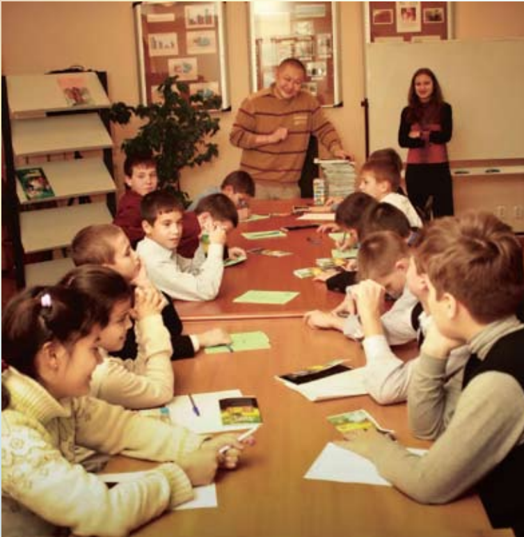
Истории, героями которых стали любимые животные ребят, войдут в книгу, которая будет выпущена в ближайшее время