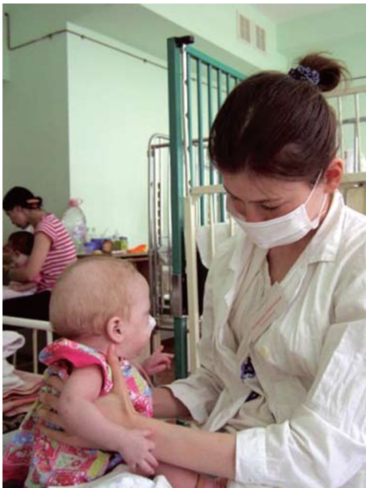
Задача волонтеров включает в себя работу «мамы» – кормление, переодевание, мытьё, хождения на процедуры, развивающие занятия

специалисты с медицинским и педагогическим образованием. Всего в «Сестринском уходе» участвуют около ста пятидесяти человек, большинство из них, конечно же, девушки.