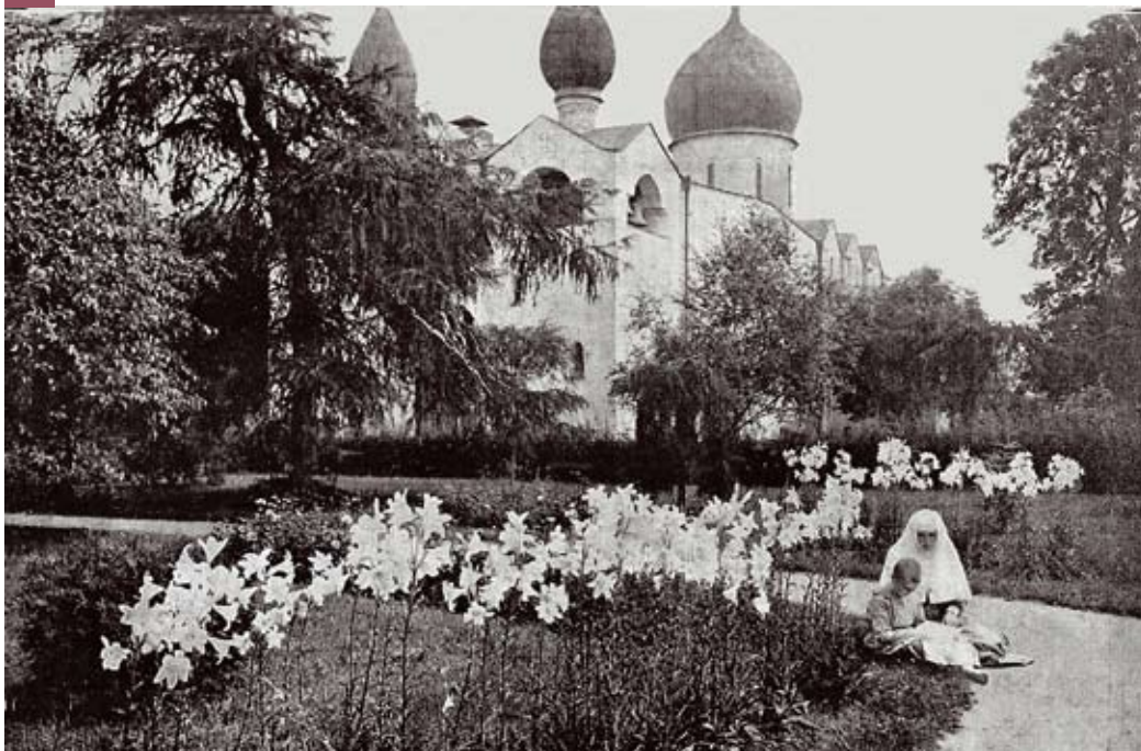
Марфо-Мариинская обитель располагается в Москве, на улице Большая Ордынка