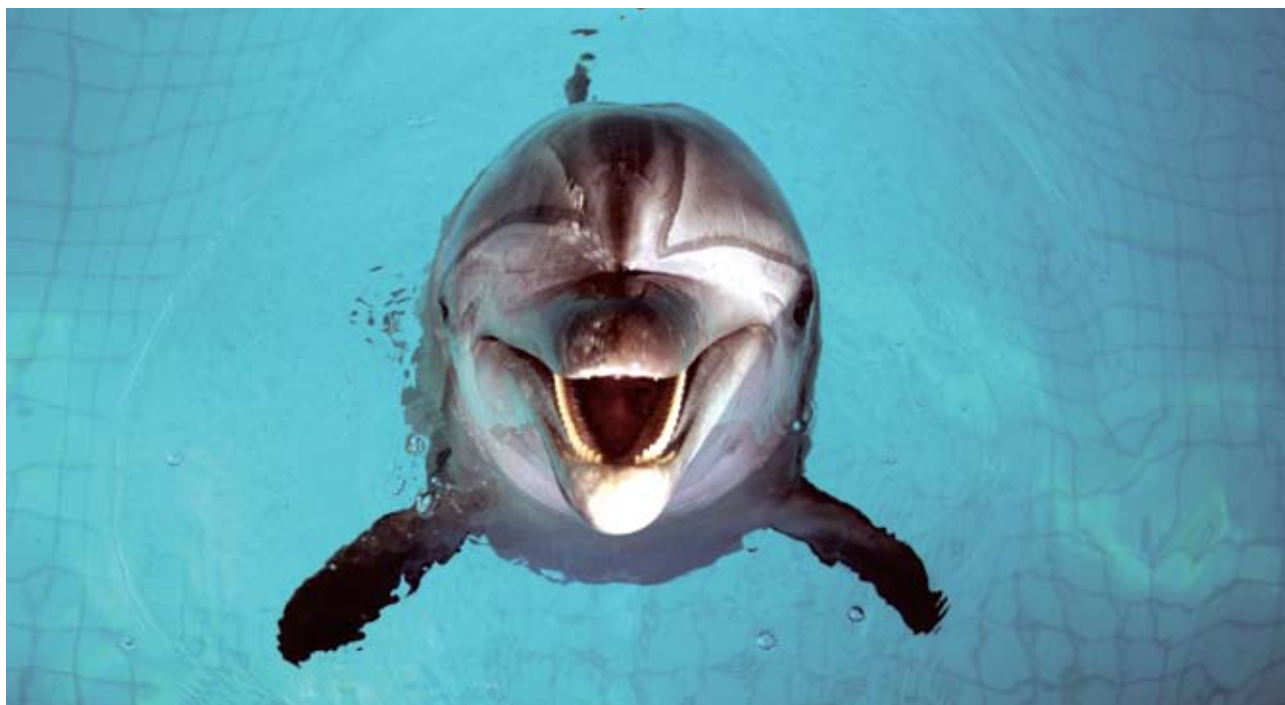
Дельфины славятся не только умом, но и особой аурой и энергетикой, которой с радостью делятся с людьми

Суть методики заключается в том, что, общаясь некоторое время с дельфинами, человек регулирует, нормализует психическое и физиологическое состояние. Ведь животные эти славятся не только умом, но и особой аурой и энергетикой, которой с радостью делятся