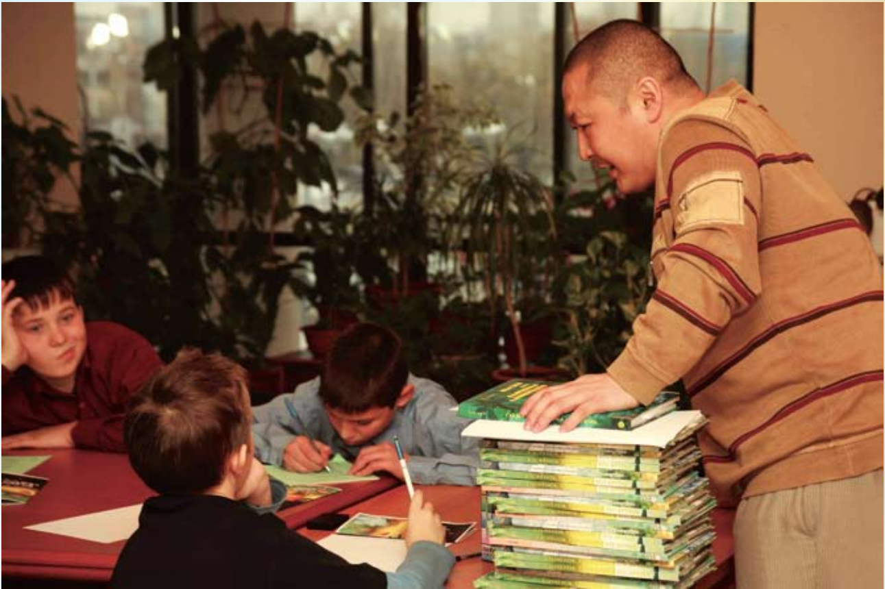
Несмотря на то, что Тенчой — «непрофессиональный» писатель, он завоевал не только любовь читателей, но и признание коллег, которые называют его «мудрец с душой поэта»

— Конечно, и взрослые могут читать мои сказки, находить в них что-то полезное для себя, — утверждает автор. — Даже если они не увлекаются буддизмом или не знают его. Во второй книжке, например, показан путь Слонёнка к Счастью. Его счастье — в помощи другим. Кто хорошо знает буддийскую философию, может найти в подтексте причинно-следственную связь — основную идею буддийской философии.