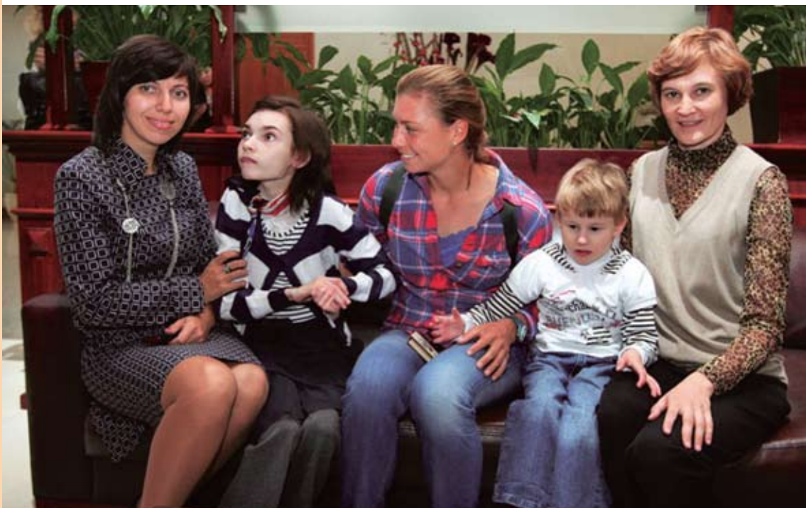
Олимпийская чемпионка Вера Звонарёва (в центре) стала инициатором создания «Ассоциации содействия больным синдромом Ретта»