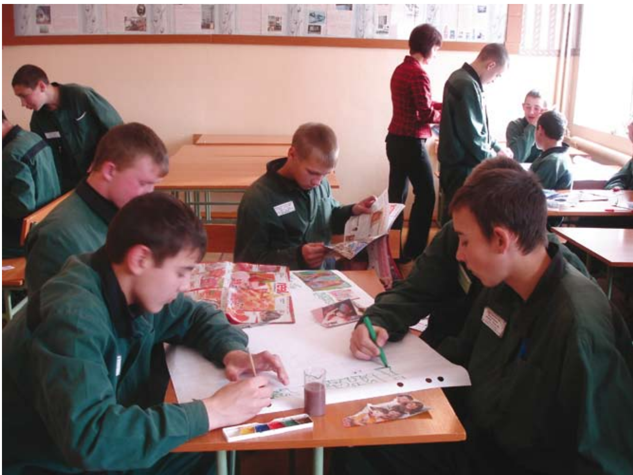
Участие воспитанников колонии в самодеятельности способствует формированию навыков коллективизма и чувства ответственности

на людей и быть готовым к позитивным переменам в своей жизни, стать открытым для тех, кто готов протянуть руку помощи.