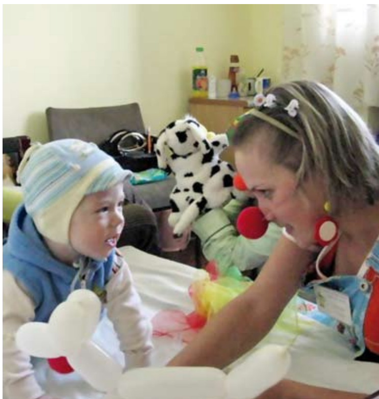
Шутками, песнями и фокусами клоуны привносят в жизнь тяжелобольных детей частичку радости и смеха

За два года организация заметно выросла вширь: есть филиал в Запорожье; несколько человек работают в Днепропе-