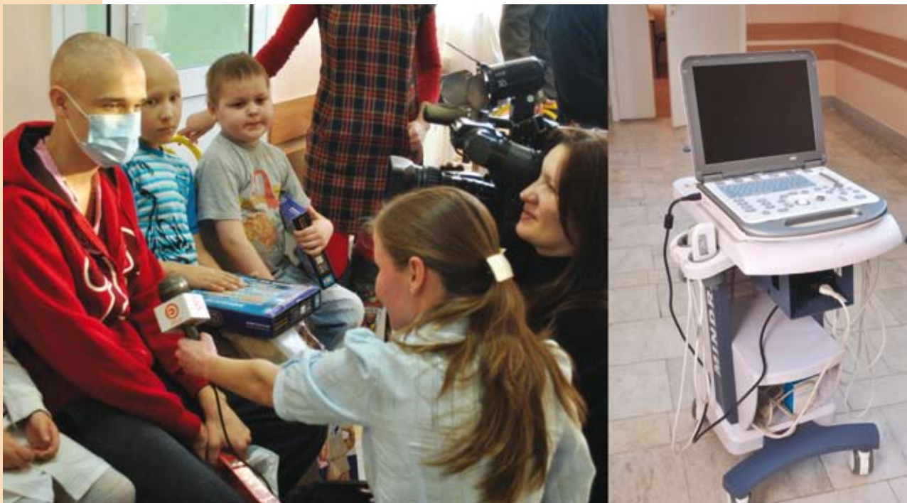
Ведущие телекомпании «Эфир» в гостях у юных пациентов онкогематологического отделения ДРКБ; новейшая медицинская техника — в подарок отделению