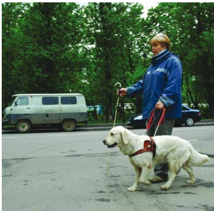
Дрессировка собаки-поводыря: учатся переходить дорогу

Ещё я обращаю внимание на необходимость тщательно изучать жилищные усло-