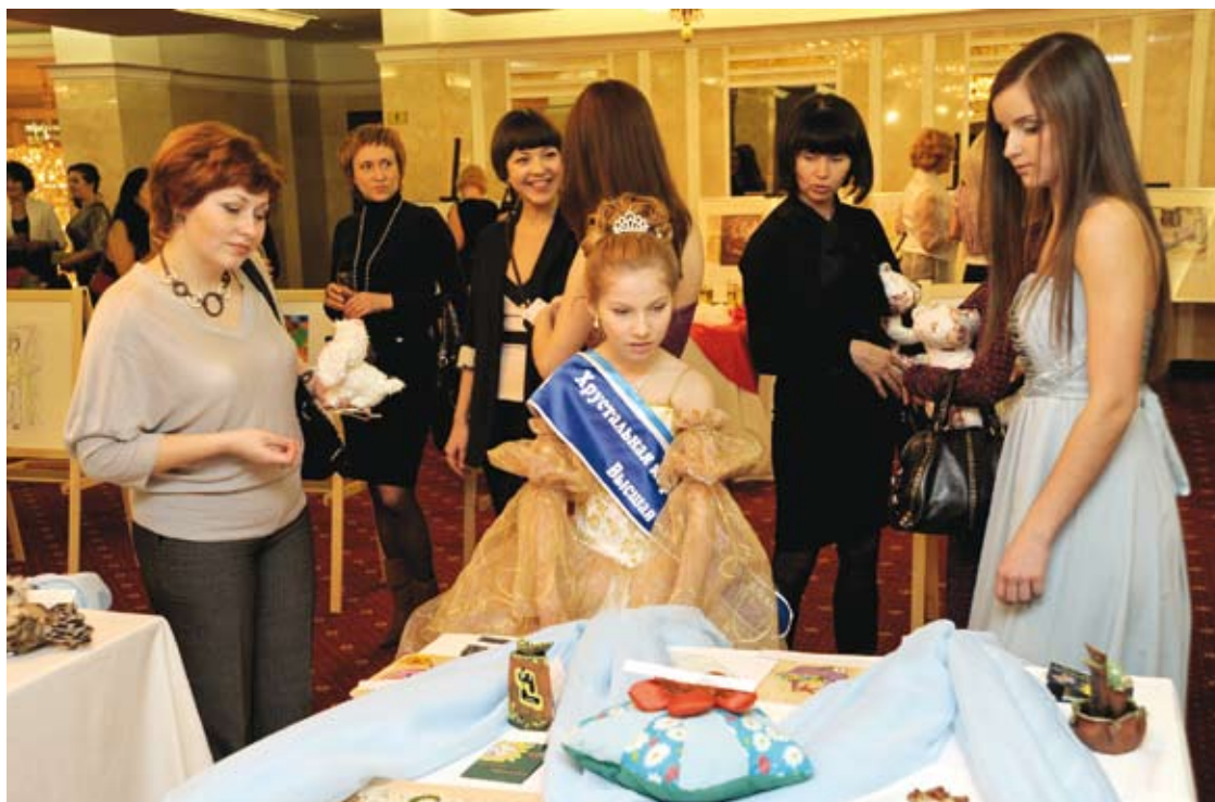
Выставка-продажа творческих работ, созданных ребятами из Детского дома Приволжского района, городского детского реабилитационного центра «Солнечный» и Центра детского творчества Вахитовского района г. Казани

Кстати, создание календаря натолкнуло на идею создания благотворительной программы под названием «Дети и твор-