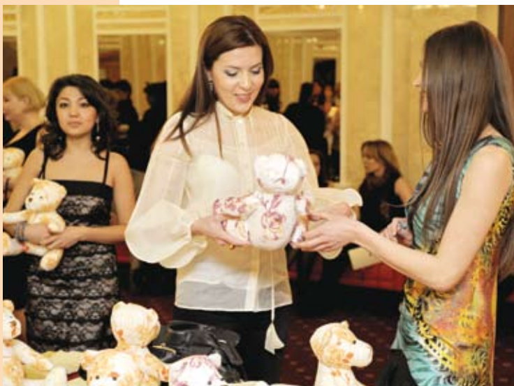
Медвежонок — символ фонда «Окно в надежду»

чество», суть которой — поддержка творческого развития ребят из детских домов. В рамках программы женщины, олицетворяющие успех и заботу, объединились в клуб «Доброе сердце» и в течение всего года будут осуществлять попечительство над детскими социальными учреждениями с помощью мероприятий по развитию творческих способностей у детей. В январе в Детском доме Приволжского района уже прошёл мастер-класс по художественному творчеству. В феврале мальчишки и девочки из этого же учреждения посетили кинотеатр и боулинг, а также побывали на мастер-классе по шитью.