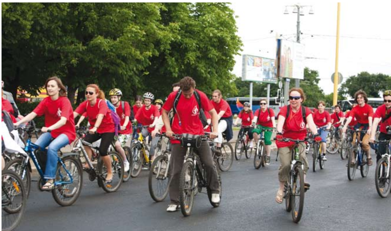
Велопробег, организованный Фондом «Подари жизнь!» в честь международного Дня донора

Один из наиболее интересных проектов был разработан совместно со Сбербанком России. Банк распространил среди своих клиентов уже около ста пятидесяти тысяч карт VISA «Подари жизнь!». С каждой тысячи рублей, потраченной по такой карте, в наш фонд перечисляются три рубля со счёта владельца карты, и еще три рубля жертвует сам банк. В марте про-