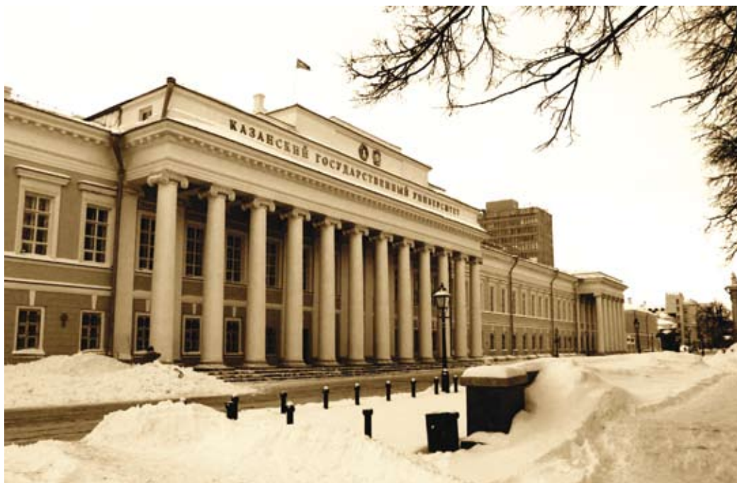
В XIX веке Казанский университет стал первым учебным заведением Казани, при котором была открыта благотворительная организация

В дореволюционной Казани благотворительные общества при образовательных учреждениях составляли почти половину всех организаций, занимавшихся филантропией. Такими обществами была охвачена практически вся система образования города — высшие учебные заведения, гимназии, прогимназии, городские училища, народные училища, татарские и крещёно-татарские школы. Помимо системной, оказывалась и разовая помощь: учащимся из бедных семей или сиротам, учреждались специальные стипендии, приобретались учебные пособия и литература, проводились ремонтные работы... Также благотворительностью можно назвать бесплатное преподавание и лечение учащихся.