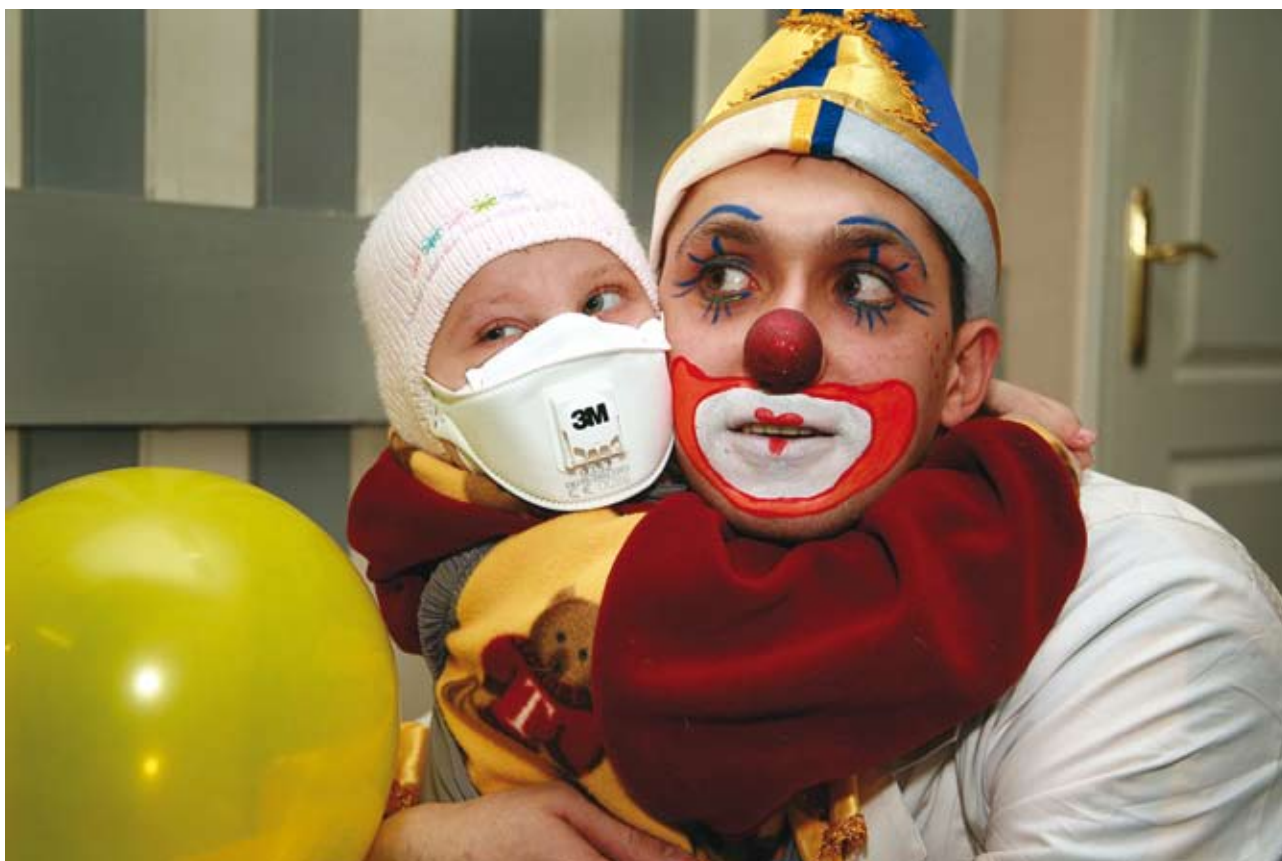
Больничной клоун приходит к детям, которые лучше, чем в компьютерных играх, разбираются в лейкоцитах, переливаниях и аплазиях

в США подтвердило, что ежедневное прослушивание такого рода «музыки» способно вывести человека из депрессии без использования медикаментов.