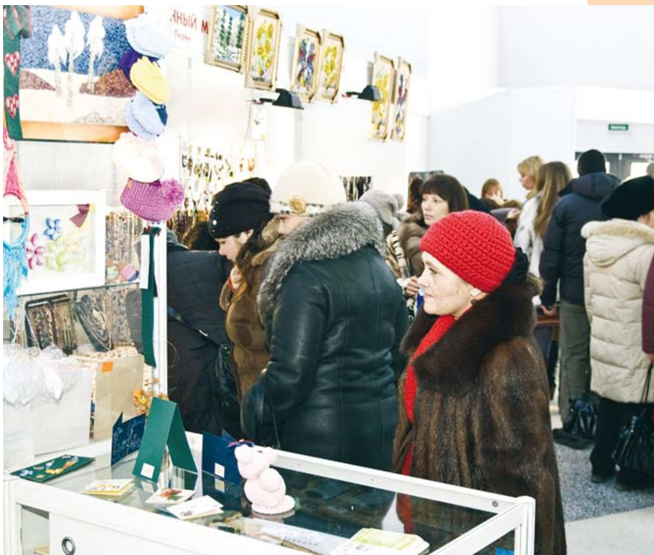
На ярмарке детских творческих работ, организованной благотворительной общественной организацией «Мамы Казани»