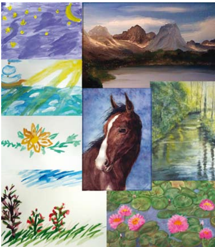
Слева — первые картины только что пришедших в мастерскую учеников; справа — картины, созданные в первые месяцы после курса