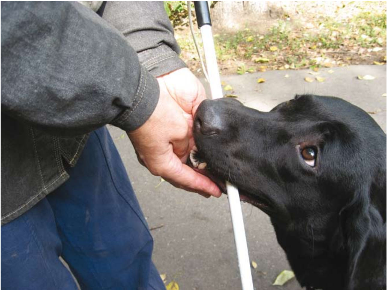
Собака-поводырь во многом превосходит «белую трость»