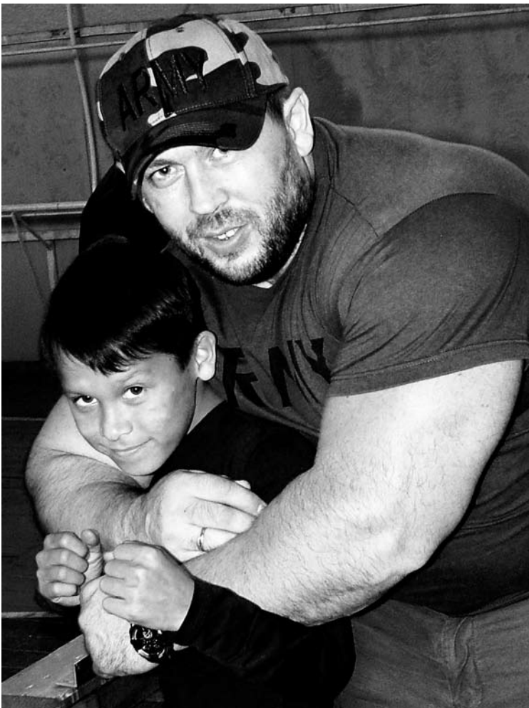
Наша задача: показать своим примером каждому ребёнку, что такое хорошо и что такое плохо

Для удобства всех участников разделили на четыре команды: «Патриоты», «Байкеры», «Банкиры» и «Ребята с нашего двора». По субботам в течение ноября и декабря команды посещали различные детдома республики, каждая со своей программой.