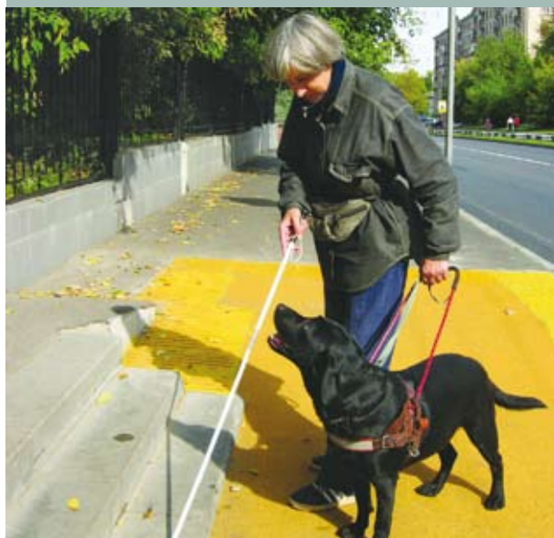
Лабрадор Жека с тренером во время дрессировки

Обучение собак-поводырей — сложная работа, требующая профессионального подхода во всём: в поиске и отборе собак, их дрессировке, а также обучении самих хозяев. Подготовка собаки стоит дорого. Будучи благотворительной организацией, существующей на средства спонсоров, мы стремимся оптимально расходовать средства. Но экономить можно не на всём. Например, приобретение породистых (а значит — дорогих) щенков — лабрадоров и голден ретриверов — обязательное условие успешной работы. Именно эти собаки идеально подходят на роль поводыря: они добродушны, легко обучаемы, работоспособны и неприхотливы в содержании. Мы очень признательны тем заводчикам, которые с пониманием относятся к проблемам инвалидов и дарят центру щенков. Все претенденты на высокое звание поводыря слепого проходят жёсткий отбор. Даже самые лучшие из них нуждаются в кропотливой и длительной дрессировке. Более полугода проходит с момента первого занятия дрессировщика с молодой собакой до того дня, когда она встретится со своим новым хозяином. С этого дня замечательная собака с красным крестом на шлейке будет всегда рядом с тем, кто нуждается в её способностях, помощи и внимании.