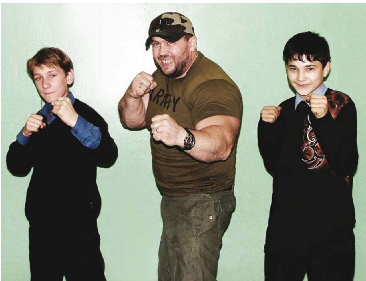
«Ребята с нашего двора» «по секрету» давали важные советы, например — как следует вести себя при нападении преступника

К чему это приводит? Не имея перед глазами положительных образцов мужского поведения, ребята легко копируют отрицательные. Откуда копируют? Наши телевидение, популярная литература, кино, не меньше чем современная действительность, заполнены образами, мягко говоря, не самых положительных героев — всевозможных преступников, «крутых» парней, воров в законе. В результате получаем страшную статистику: сорок пять процентов выпускников детских домов попадают в тюрьмы, тридцать пять процентов спиваются, десять процентов погибают и лишь каждый десятый относительно успешен.