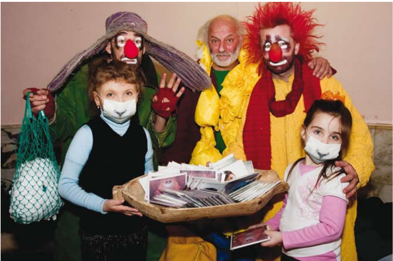
Вячеслав Полунин и его клоунская команда подарили подопечным фонда маски с забавными звериными мордочками

ют жизненно необходимы импортные препараты, для ввоза которых требуется каждый раз оформлять разрешительные документы, как-то провозить их в своих чемоданах. Считаю, это неразумная трата волонтерской помощи. Вопрос нужно решать на государственном уровне.