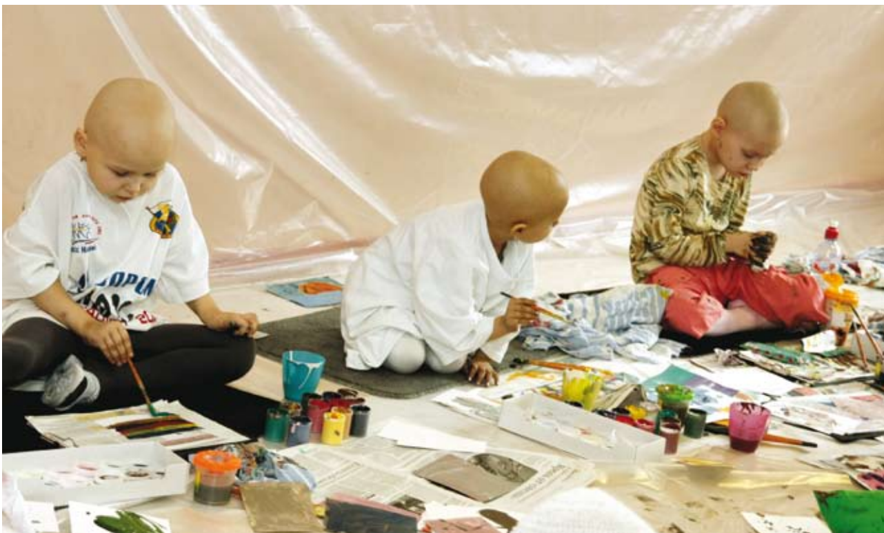
Благодаря занятиям в «Творческом доме» детям, находящимся на длительном лечении, удается на время забыть о больничной обстановке и отдаться процессу творчества

суйте, как чувствуете. Оставайтесь сами собой. Будьте как дети. Не думайте о правилах, дайте волю кисти. И вы будете поражены созданным».