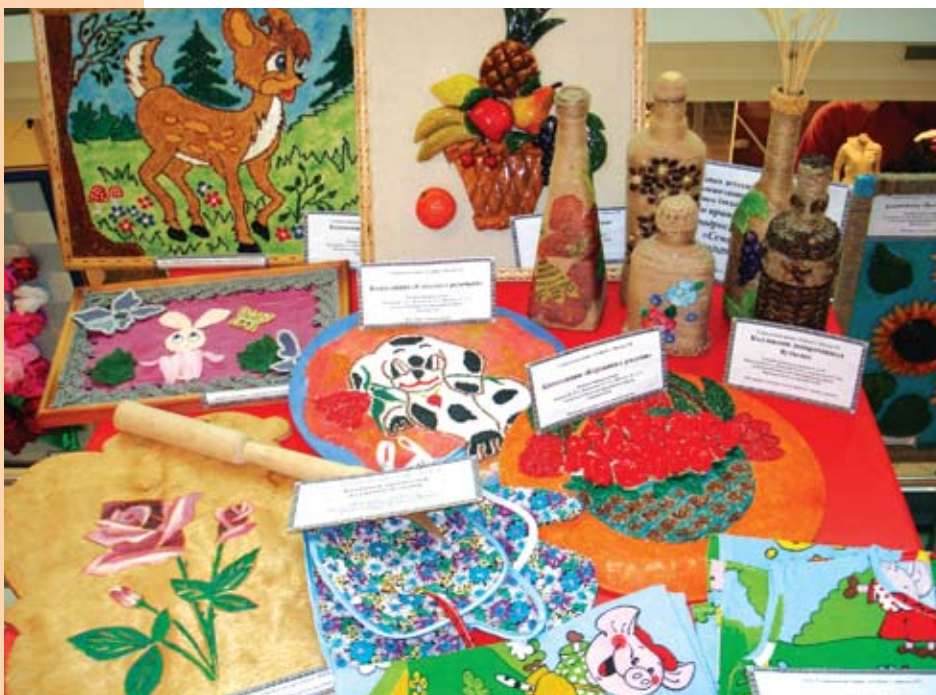
На выставке «Мир ребёнка» были представлены творческие работы воспитанников приютов