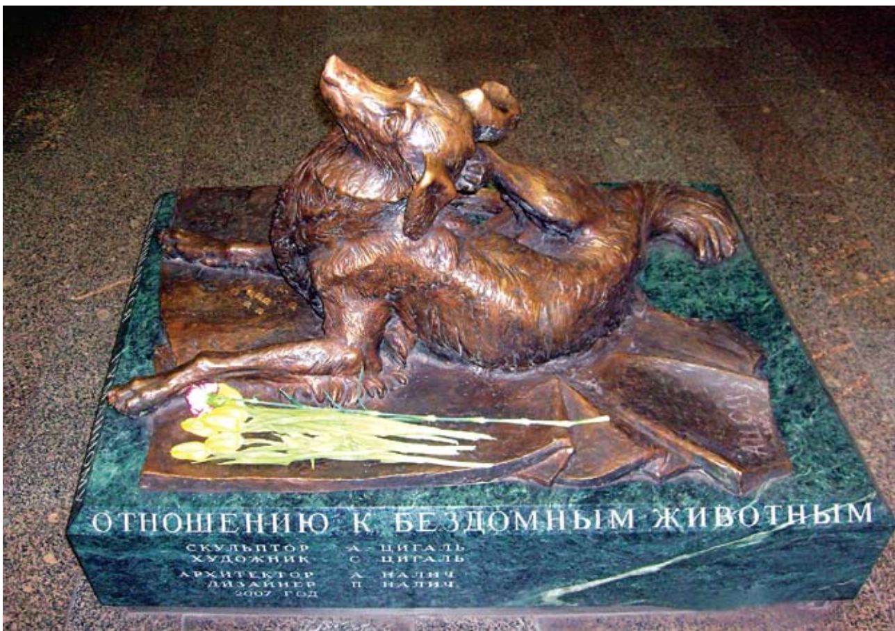
В Москве на станции метро «Менделеевская» установлен памятник бездомной собаке. Скульптурная композиция «Сочувствие» посвящена трагически погибшей дворняге по кличке Мальчик, долгое время опекаемой работниками метрополитена

решаются по мере возможностей. Как правило, помогают всё те же любители животных, которые могут проникнуться состраданием к ним. Только вот решения проблемы безнадзорных животных на государственном уровне в России пока нет. Может, стоит обратиться к зарубежному опыту?