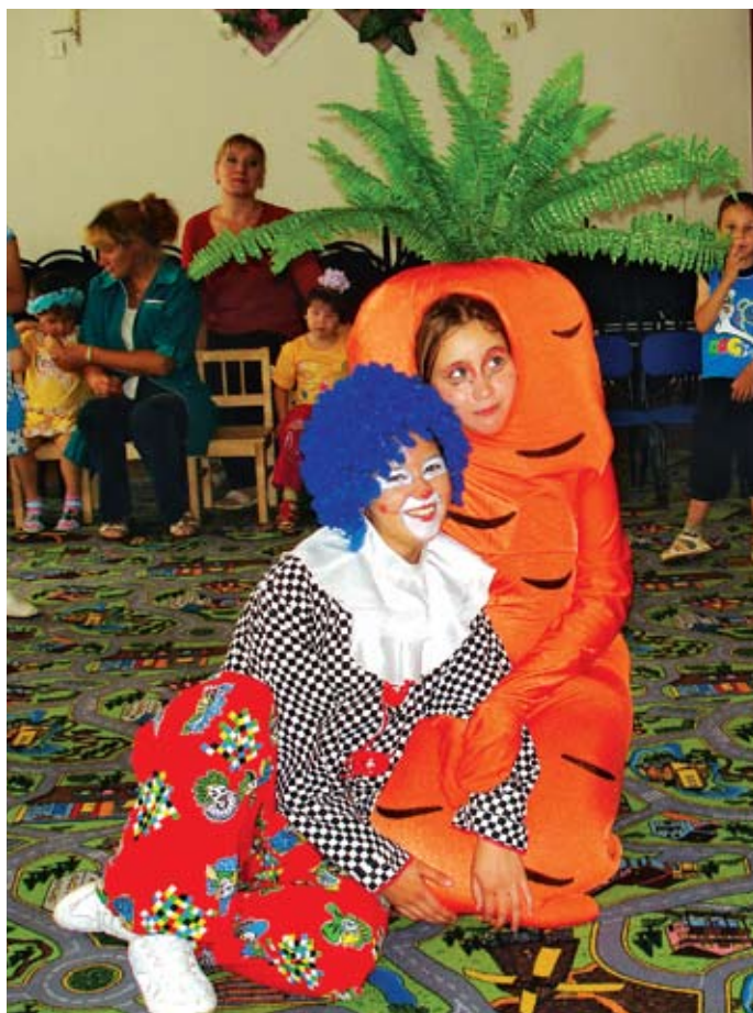
Весёлые клоуны акции «Снова в школу!» вручили подарки воспитанникам приютов