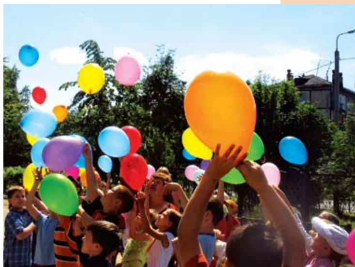
В завершение акции «Мир без наркотиков» ребята, загадав желания, отпустили в небо воздушные шары