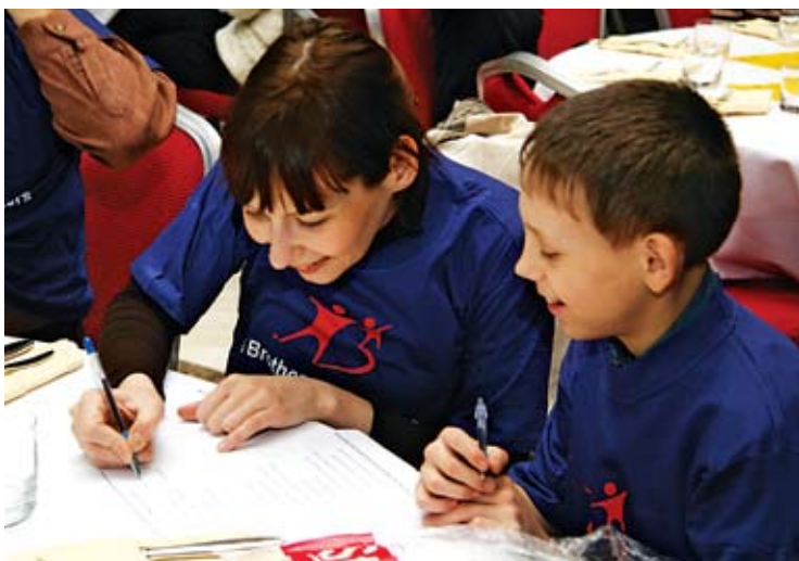
Старшая Сестра и Младший Брат