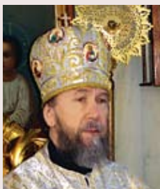
Архиепископ Казанский и Татарстанский владыка Анастасий