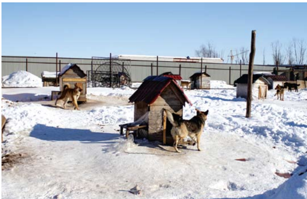
Приют для бездомных животных в посёлке Столбищи

до сих пор знают далеко не все. Задача информирования населения для сотрудников этой организации — одна из главных. Здесь её решают ежедневно. Приют сотрудничает со школами, для ребят читаются лекции о животных, об уходе за ними, они узнают о проблеме бродячих братьев наших меньших. Был и опыт организации концертов с участием казанских рок-групп, проведения субботников.