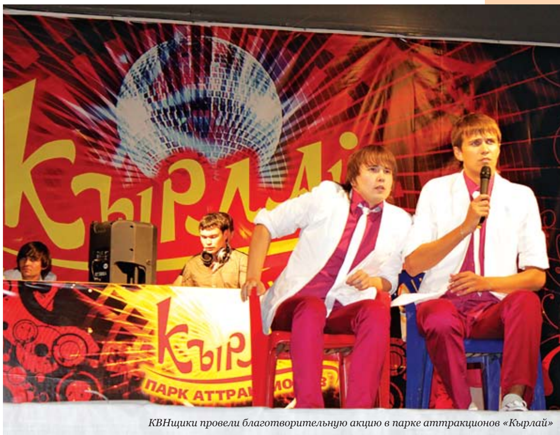
КВНщики провели благотворительную акцию в парке аттракционов «Кырлай»

Пресс-служба сборной команды КВН Республики Татарстан «Четыре Татарина»