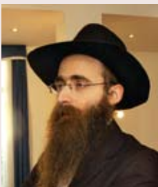
Главный раввин Татарстана Ицхак Горелик