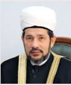
Муфтий Гусман хазрат Исаков — председатель Духовного управления мусульман Республики Татарстан, сопредседатель Совета муфтиев России